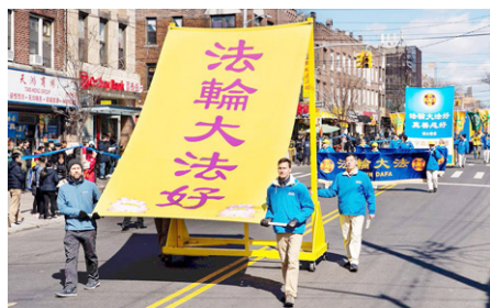
▲海外法轮功学员游行中的巨型横幅

记得第一次我要他们一起小声朗读时，他们却大声读出声来，几乎整栋教学楼都听到了。反正全校师生都知道我是法轮功学员，我也不管了。有些我教过的学生或没任教的学生，校园内外见到我时，不喊“老师好”，而是喊：“法轮大法好”。十几年来，一直都有。