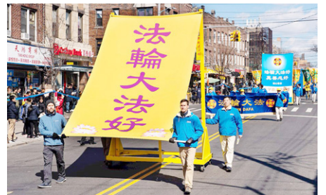
▲海外法轮功学员游行中的巨型横幅

记得第一次我要他们一起小声朗读时，他们却大声读出声来，几乎整栋教学楼都听到了。反正全校师生都知道我是法轮功学员，我也不管了。有些我教过的学生或没任教的学生，校园内外见到我时，不喊“老师好”，而是喊：“法轮大法好”。十几年来，一直都有。