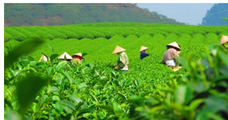
采茶工从另条陡峭的路上山采茶，成为令人津津乐道而又不可思议的事。

3 个月后，我的烟酒全部戒掉了，所有那些坏习惯全部戒掉了，以前满嘴脏话，也全消失了。我把长发和胡子全部剪掉，人变得精神了，生活里有了阳光。