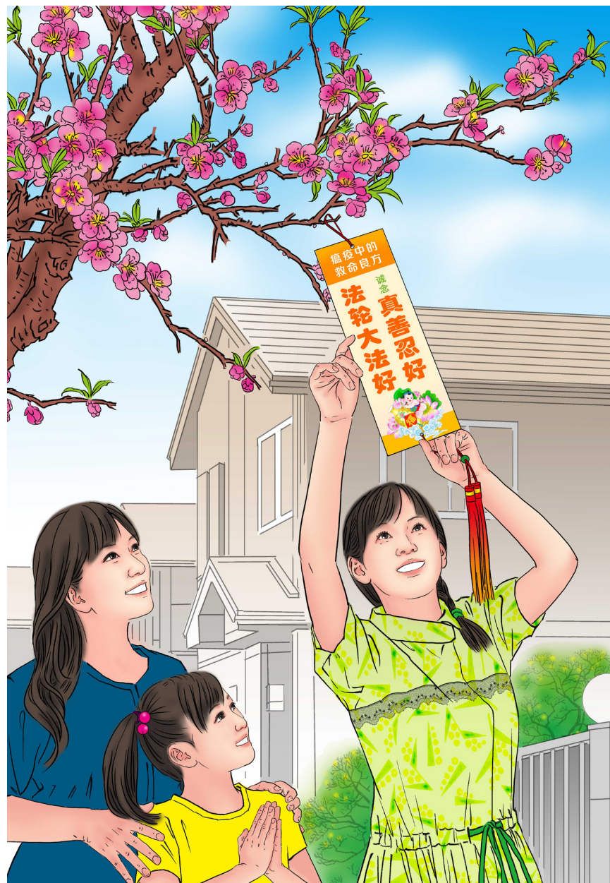
绘画作品：《春暖花开》