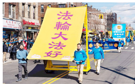
▲海外法轮功学员游行中的巨型横幅

记得第一次我要他们一起小声朗读时，他们却大声读出声来，几乎整栋教学楼都听到了。反正全校师生都知道我是法轮功学员，我也不管了。有些我教过的学生或没任教的学生，校园内外见到我时，不喊“老师好”，而是喊：“法轮大法好”。十几年来，一直都有。