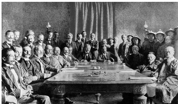
▲辛丑条约签署时的情景（网络图片）

【明慧网】中共因掩盖疫情而遭到全球追责，世界各国政府与民间谴责中共并要求赔偿，国内的文宣便抛出庚子赔款事件，挑动民众民族主义情绪，将国际追责诉讼比作是西方列强对中国人民的恶意压迫、敲诈与侮辱。然而，庚子赔款真如中共的历史教科书所说的那样吗？