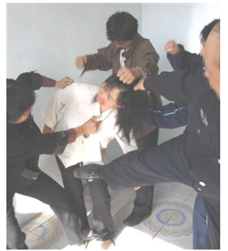
▲酷刑图：手铐、脚镣；长时间逼坐小板凳、拳打脚踢