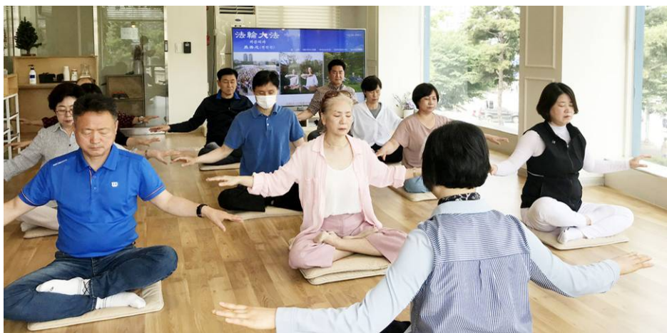
▲九讲班中，新入门的学员在学炼法轮功第五套功法——神通加持法。

她说，自己平时身体虚弱，头痛、颈痛、全身沉重如灌铅。“但是学习班第 1 天结束，回家第二天一觉醒来时，发现头痛全消失了，感觉身体变成了羽毛，轻飘飘而舒畅。”学习班的前 3 天，她感觉身体越来越轻松，好像要飞起来了。