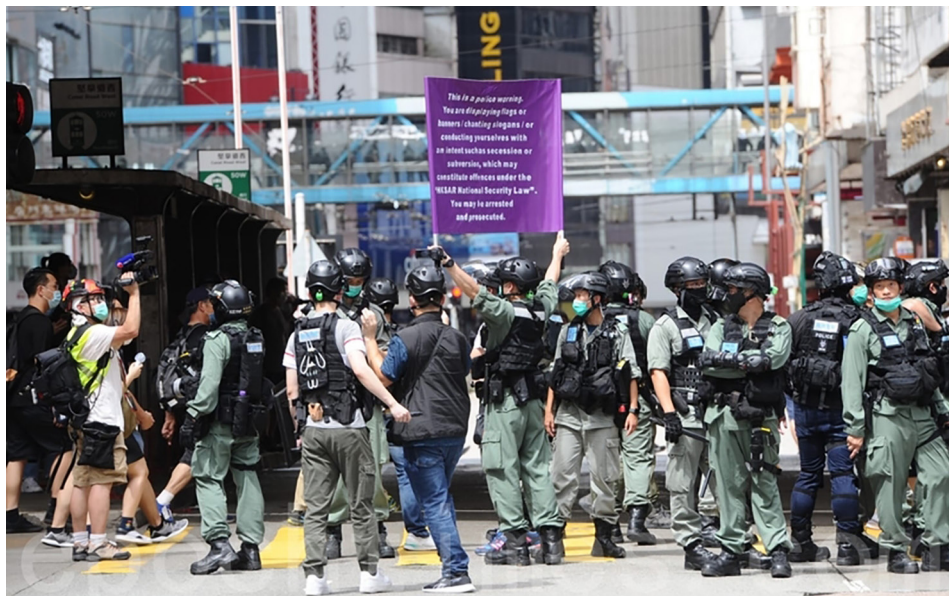
2020年7月1日，香港“7·1”大游行，防暴警察向市民展示“违反港区国安法”的紫旗，上面写着：“这是警方发出的警告。你们现在展示旗帜或横额叫喊口号或其他行为，有分裂国家或颠覆国家政权等意图，有可能构成《港区国安法》的罪行，你们可能会被拘捕及刑事检控”。