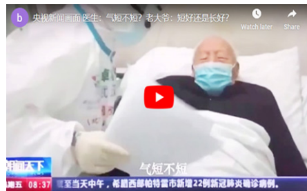
▲ 央视新闻画面——医生：气短不短？老大爷：短好还是长好？

其实，所谓“天安门自焚”，就是中共自导自演的骗局。法轮功书籍中明确指出杀生和自杀都是有罪的，真正的修炼人绝不会杀生或自杀、自焚的。◇