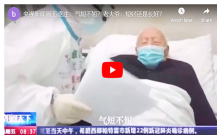
▲ 央视新闻画面——医生：气短不短？老大爷：短好还是长好？

其实，所谓“天安门自焚”，就是中共自导自演的骗局。法轮功书籍中明确指出杀生和自杀都是有罪的，真正的修炼人绝不会杀生或自杀、自焚的。◇