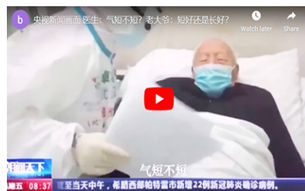
▲ 央视新闻画面——医生：气短不短？老大爷：短好还是长好？

其实，所谓“天安门自焚”，就是中共自导自演的骗局。法轮功书籍中明确指出杀生和自杀都是有罪的，真正的修炼人绝不会杀生或自杀、自焚的。◇