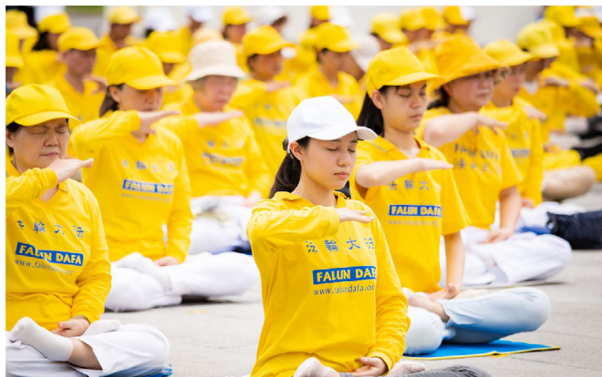
2020年5月，台北法轮功学员集体炼功，带给世人祥和与美好。

以前经常听亲戚说绝症患者 炼法轮功身体得到康复，我都认为是瞎扯，现在却真实地发生在我身上了。