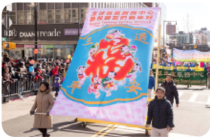
法轮功学员游行, 昭示民众“三退保平安”。

2020年11月的一天, 卡车拉了满满一集装箱做家具的木板停在我厂库房前。木板长约2.5米, 每捆木板约1.2米高, 一吨重, 两捆就有两吨重。