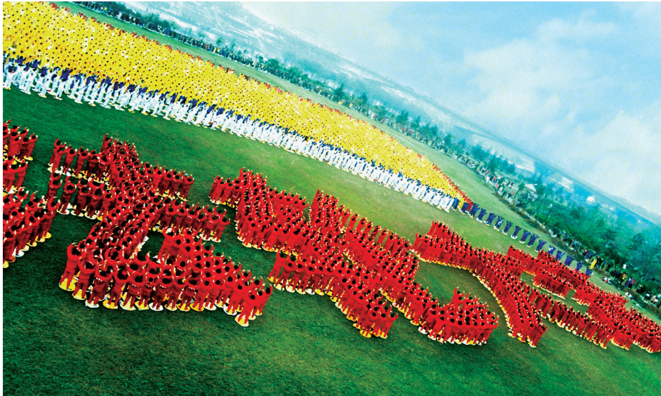
在中共迫害法轮功之前，1999 年 3 月，武汉法轮功学员排字炼功的壮观景象。

在当年的气功热中，法轮功独树一帜。自 1992 年传出后，以祛病健身、净化身心的奇效传遍大江南北，很多老干部、高级知识分子都学炼法轮功，很多人的顽疾不治而愈。1998 年时任中共人大委员长乔石根据对法轮功的详细调查和研究，得出“法轮功于国于民有百利而无一害”的结论，并向政治局提交了报告。但中共党魁江泽民仍然一意孤行，在 1999 年发起了对法轮功的残酷打压与迫害。江泽民多次以“两弹一星”元勋颁奖、拜年、祝寿等名义，亲自去看已瘫痪十多年的钱学森，希望胁迫他站出来反对特异功能和法轮功，“口头”或“书面”都行。然而钱学森在这个问题上却始终不改变自己的观点。