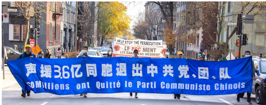
▲ 2020年11月7日,加拿大魁北克法轮功学员大游行。