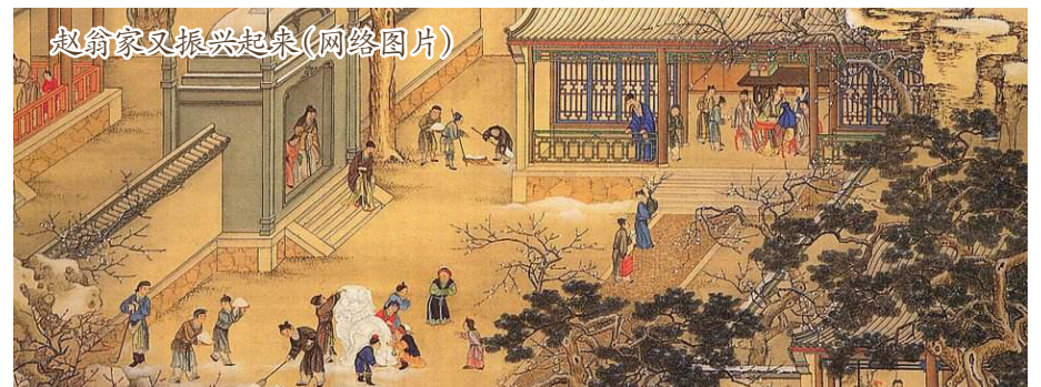
赵翁家又振兴起来