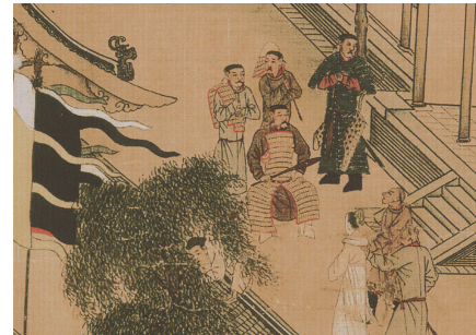
赵翁被充军（网络图片）

迎接他，请他进去。他后面有位老者头戴宝石顶，站在门内等候着，并向赵翁行礼，请他到厅堂上座。