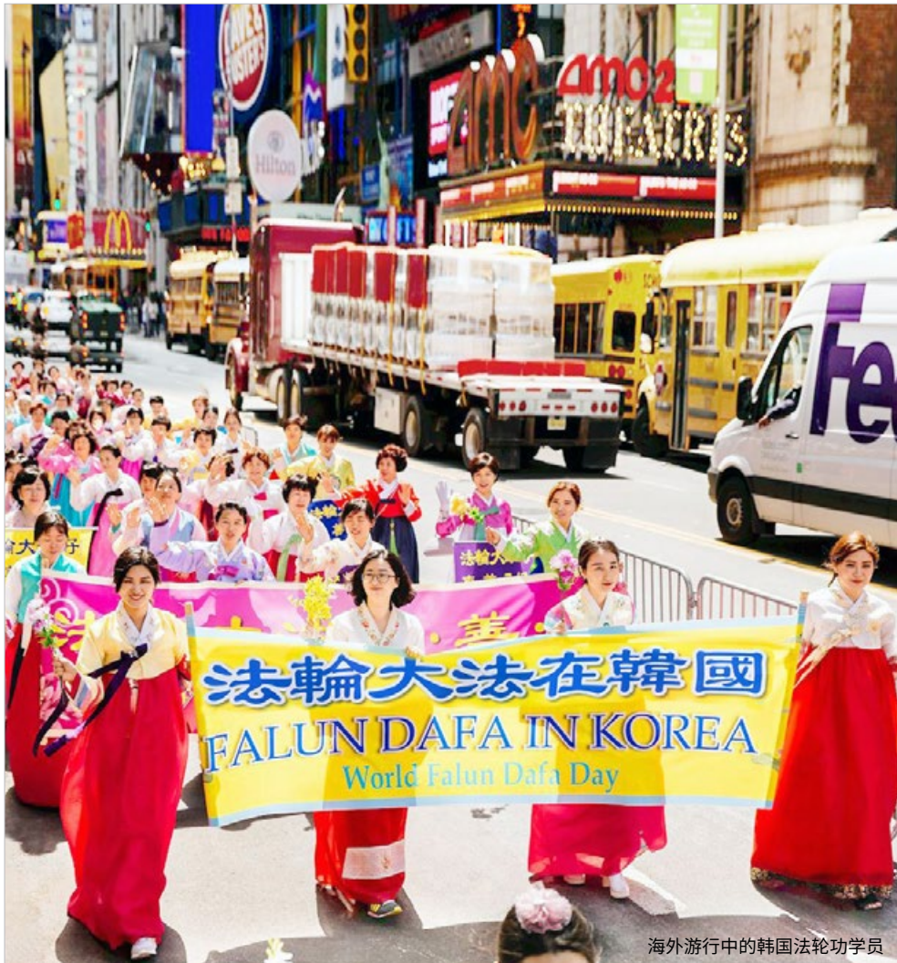
海外游行中的韩国法轮功学员