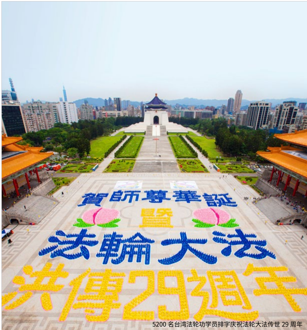
5200 名台湾法轮功学员排字庆祝法轮大法传世 29 周年