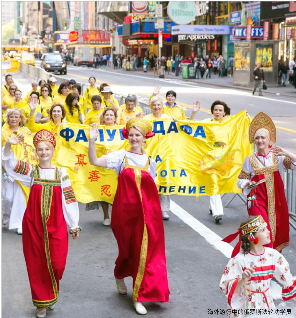
海外游行中的俄罗斯法轮功学员