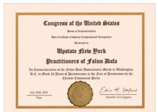
美国国会众议院 2021 年 7 月颁发特别表彰，以铭记法轮功学员面对中共迫害，坚守 22 年。