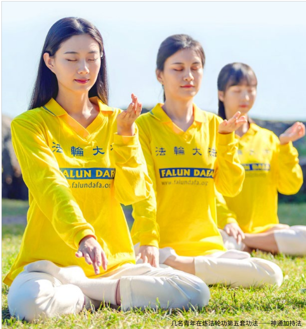
几名青年在炼法轮功第五套功法——神通加持法