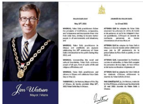
加拿大首都渥太华政要赞扬法轮功学员促进社会道德回升。图为市长吉姆·沃森的褒奖。