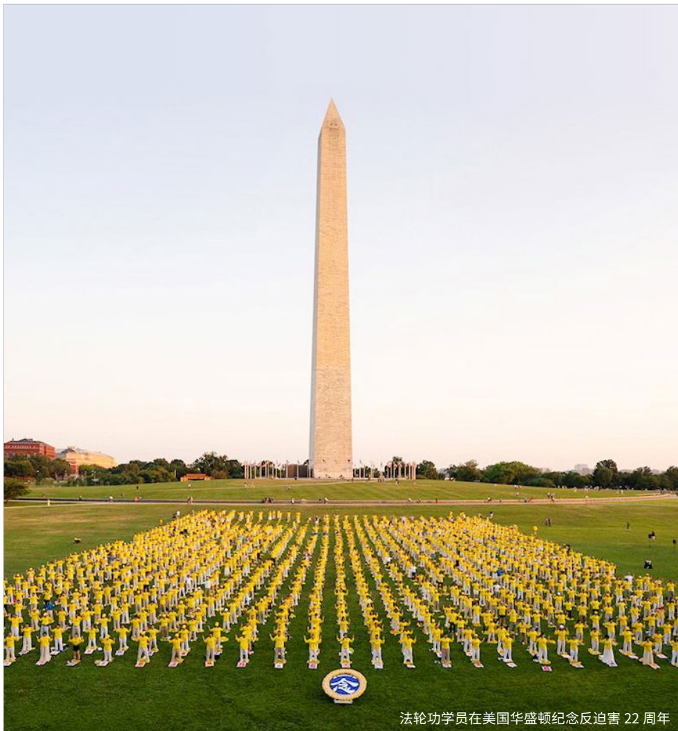
法轮功学员在美国华盛顿纪念反迫害 22 周年