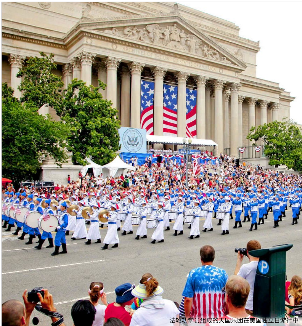
法轮功学员组成的天国乐团在美国独立日游行中