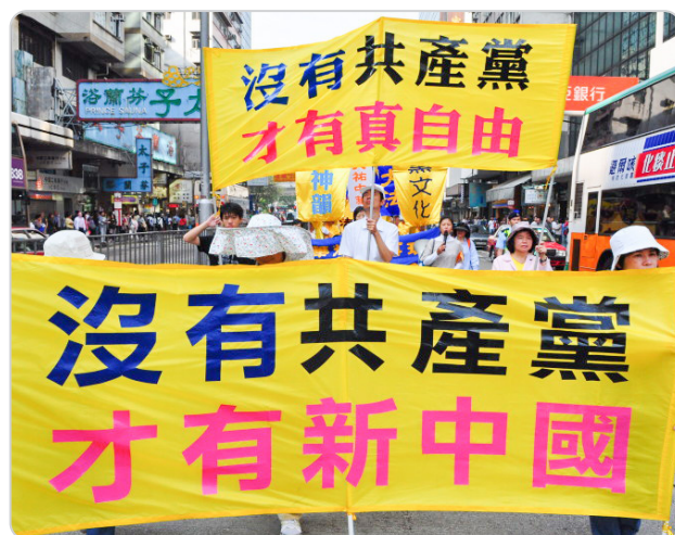
◎ 现在越来越多的善良、正义之士都明白了一个真理，那就是：“中共不等于中国”“爱国不等于爱党”。