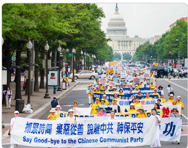
◎ 法轮功学员游行队伍浩浩荡荡穿越美国华盛顿中心大道，告诉大陆同胞早日退出中共，拥有美好未来。

河北省某乡党委书记，听信了中共谎言宣传，怕丢官，要办“洗脑班”，把乡里法轮功学员抓起来“洗脑”。一天，乡书记的亲戚请他和朋友喝酒，他喝得半醉时，就把想办“洗脑班”的事吹嘘一通，显示自己有工作能力。其中有朋友赶紧劝他：你可别干傻事，谁干谁倒霉，还殃及家人。你看过法轮功真相传单吗？许多官员遭恶报了；那个江蛤蟆也在全世界被起诉了。人家信仰“真善忍”也没错啊！现在世界上100多个国家炼呢。又一个朋友说：我看了一本书叫《九评共产党》，真有恍然觉悟的感觉，现在都在“退党”保命，你还敢干这个？书记听了酒醒一半：难道朋友说的都是真的？乡书记赶紧看《九评共产党》，也有恍然觉悟的感觉，他明白了真相，做了“三退”（退出中共党、团、队）。