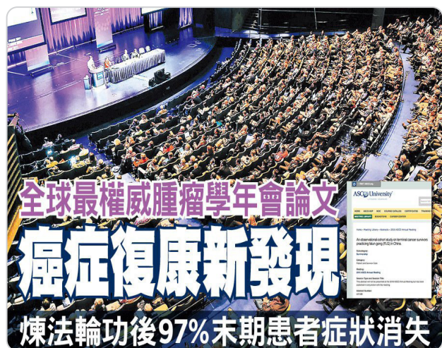
◎ 美国临床肿瘤学会年会上，癌症末期患者修炼法轮功痊愈的研究成果，引起国际医学界的关注与赞誉。

九字真言“法轮大法好！真善忍好！”里边，蕴藏着宇宙纯正的能量，诚心地敬念，不但能解人于危难之中，而且在茫茫的黑暗中，会照亮您脚下前行的方向。