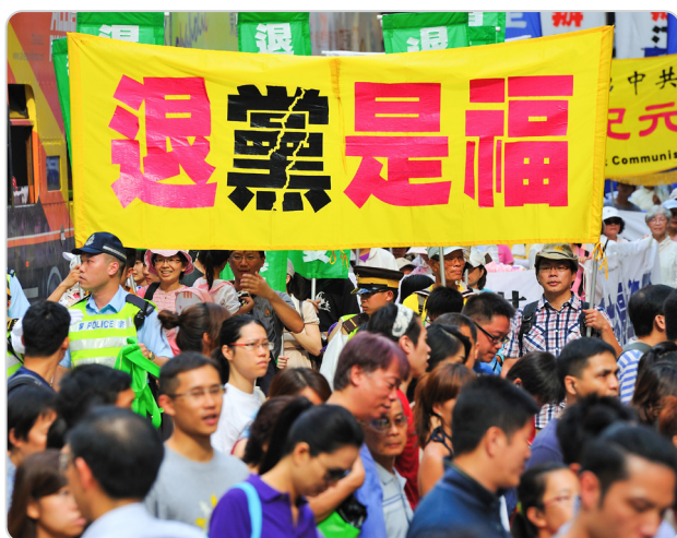
◎ 《九评共产党》一书揭露了中共“假恶暴”的本质，引发“三退”大潮。“退党是福”成为大陆流行语。

河北省某乡党委书记，听信了中共谎言宣传，怕丢官，要办“洗脑班”，把乡里法轮功学员抓起来“洗脑”。一天，乡书记的亲戚请他和朋友喝酒，他喝得半醉时，就把想办“洗脑班”的事吹嘘一通，显示自己有工作能力。其中有朋友赶紧劝他：你可别干傻事，谁干谁倒霉，还殃及家人。你看过法轮功真相传单吗？许多官员遭恶报了；那个江蛤蟆也在全世界被起诉了。人家信仰“真善忍”也没错啊！现在世界上100多个国家炼呢。又一个朋友说：我看了一本书叫《九评共产党》，真有恍然觉悟的感觉，现在都在“退党”保命，你还敢干这个？书记听了酒醒一半：难道朋友说的都是真的？乡书记赶紧看《九评共产党》，也有恍然觉悟的感觉，他明白了真相，做了“三退”（退出中共党、团、队）。