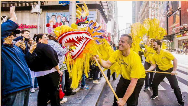
◎ 史考特在法轮功学员组成的舞龙队里当龙头手，向西方人展现中国传统文化。他身形矫健，反应敏锐。修炼法轮功22年来，他没跟公司请过一天病假。