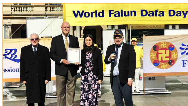
◎澳洲各级政要2021年5月表彰法轮功，图为帕拉马塔市市长颁发褒奖令。联邦参议员威尔斯说：法轮功以“真善忍”的道德指引，改善了全球数百万人的生活。

两年兵役结束，他回家上学，电游瘾又来了，但每次玩过后，他心里都不自在：“玩游戏时，我的心态是在争斗，在伤害对方，这不符合法轮功‘真善忍’的原则呀！”纠结中，他每天读法轮功主要著作《转法轮》，希望戒掉电游。一天他打开电脑，猛然醒悟，心想：“我多蠢啊，这不是在浪费生命吗？”他迅速卖掉全套电游装备，生活从此回到正轨。他坚持读《转法轮》，头脑清晰，以优异成绩完成了学业，现在从事着自己喜欢的房产中介工作。