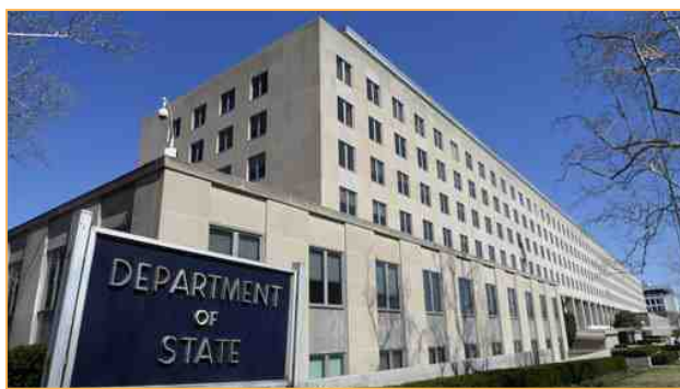
© 2021 年 5 月 12 日，美国政府宣布制裁一名迫害法轮功的中共官员——四川省成都市前“610”办公室主任余辉，禁止其本人及亲属入境。

美国国务院 2021 年 5 月 12 日宣布，制裁中共迫害法轮功的官员、四川省成都市前“610 办公室”主任余辉，禁止其本人及亲属入境。国务卿布林肯表示，此项制裁是根据 2021 年《外国行动及相关计划拨款法》。截至 2020 年 12 月，已有来自 35 个国家超过 900 名政要在一份联合声明上签名，要求中共停止迫害法轮功，他们同时赞扬法轮功学员 21 年来坚持和平、理性反迫害的精神。