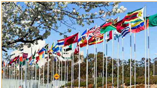
© 2020 年 12 月 10 日世界人权日之际，加拿大、瑞典、美国、英国、德国、法国、意大利等 35 个国家的 900 名政要联署，要求中共停止迫害法轮功。