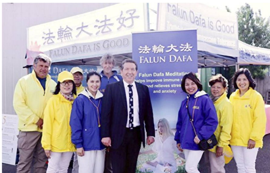
市长克拉克在花展上与法轮功学员合影

赵锦荣认为，加拿大过度乐观地以为和极权国家有交流、对话、沟通，就可以改变对方，从而令其减少对自己国民的欺压、减少对不同宗教人士的打压；看不到其实这些极权国家的本质从未改变。◇