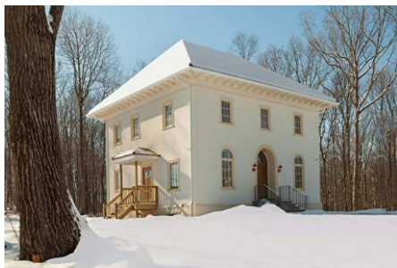
▲詹姆斯·史密斯设计的新古典主义住宅。

使他发生根本改变的是因为他接触并体验了源于中国的一种古老的修炼方法——法轮功。这种