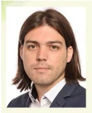
◀ 欧洲议会议员辛奇克