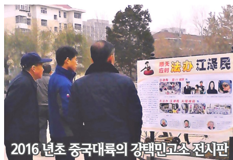
2016년초 중국대륙의 강택민 고소 전시판

로 강택민, 라간, 류경, 주영강, 리란칭 등 5명을 안성(安省) 고급법원에 기소했다. 강택민 기소안은 전세계의 지지를 받아 제 2차 세계대전 이래 전세계에서 가장 큰 국제인권 소송안건으로 됐다. 2014년 2월 10일, 서반이아 고급법원 법관 이스메일은 ‘종족학살죄’, ‘고문죄’, 와 ‘반인류죄’로 강택민에게 체포와 감금령을 발포했다. 2015년에는 중국대륙에서 20 만명을 초과한 파룬궁