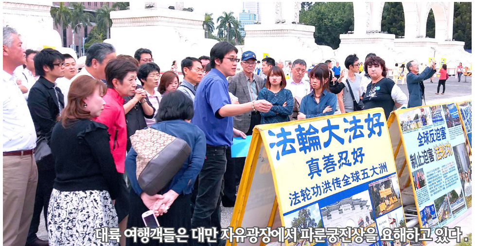
대륙 여행객들은 대만 자유광장에서 파룬궁진장을 요해하고 있다.

2015년 아시아의 한 유람지에 한무리 고급간부들이 왔다. 그 중 한분은 부부(副部)