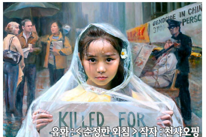
유화: <순정한 외침> 작자: 천사오핑

국제대사와 캐나다 정부의 방조하에 장쿤룬은 2001년 1월 10일 기한전에 석방되어 캐나다로 돌아갔다. 다시 자유를 얻은 장쿤룬은 예술형식을 통해 박해정지를 호소했으며, 파룬궁 박해를 폭로하는 작품을 창작했다. (5면에 계속)