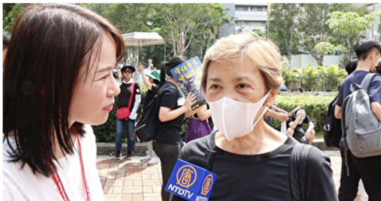
◀香港著名明星叶德嫻（右）接受大纪元新唐人记者黄瑞秋直播访问。（视频截图）

共产主义一百多年的历史表明，共产幽灵所到之处，不是战乱、饥荒、屠杀和恐怖，就是谎言、虚假与道德沦丧。共产运动造成了全球一亿人的非正常死亡。共产主义对人类信仰的迫害、对普世价值的颠覆，更是史无前例。当今，全球已有3.7亿人退出了中共党团组织。共产主义是绝路已经是所有明眼人的共识。◇