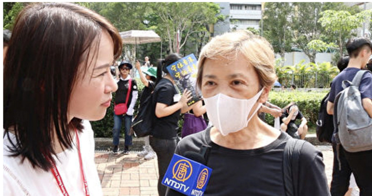
◀香港著名明星叶德嫻（右）接受大纪元新唐人记者黄瑞秋直播访问。（视频截图）

共产主义一百多年的历史表明，共产幽灵所到之处，不是战乱、饥荒、屠杀和恐怖，就是谎言、虚假与道德沦丧。共产运动造成了全球一亿人的非正常死亡。共产主义对人类信仰的迫害、对普世价值的颠覆，更是史无前例。当今，全球已有3.7亿人退出了中共党团组织。共产主义是绝路已经是所有明眼人的共识。◇