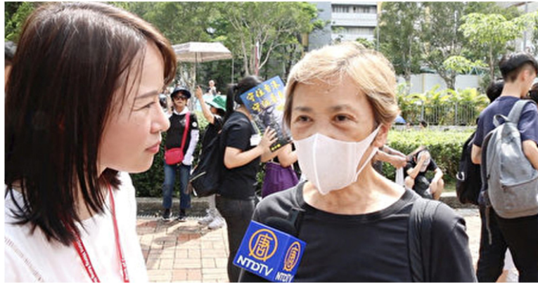
◀香港著名明星叶德嫻（右）接受大纪元新唐人记者黄瑞秋直播访问。（视频截图）

共产主义一百多年的历史表明，共产幽灵所到之处，不是战乱、饥荒、屠杀和恐怖，就是谎言、虚假与道德沦丧。共产运动造成了全球一亿人的非正常死亡。共产主义对人类信仰的迫害、对普世价值的颠覆，更是史无前例。当今，全球已有3.7亿人退出了中共党团组织。共产主义是绝路已经是所有明眼人的共识。◇