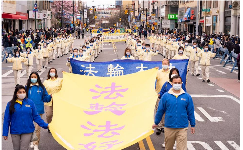
▲纪念“四二五”和平上访二十二周年，上千名纽约法轮功学员举办游行

“看到法轮功，（就）看到人类的希望，看到世界的希望。这么大型的游行队伍，这么多人在坚持