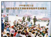
1999年4月21日 法轮功学员在天津教育学院和平反映情况 法轮功学员在天津教育学院和平反映情况

于是就有了后来上万名法轮功学员，自发前往北京上访。他们怀着对政府的信任，提出了三点诉求：一、释放被非法抓捕的天津法轮功学员；二、允许法轮功书籍