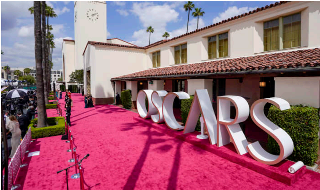
第 93 届奥斯卡金像奖颁奖典礼，2021 年 4 月 25 日在洛杉矶举行。