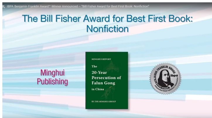
独立图书出版商协会（IBPA）颁发的“本杰明·富兰克林奖”之首发书奖 左图：《明慧报告》书籍封面