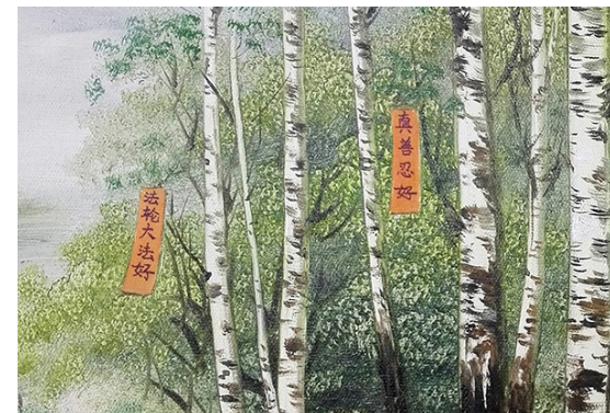
油画《白桦树下》局部

在世界各地，都有人在感染新冠病毒、得不到救治的情况下，念“法轮大法好，真善忍好”很