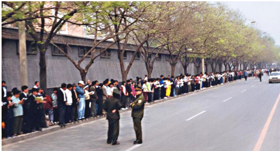
1999年4月25日上访现场秩序井然，警察不用维持秩序，在一旁聊天。