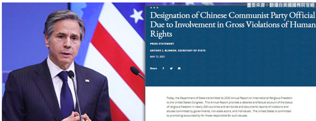
美国国务卿布林肯在新闻发布会上