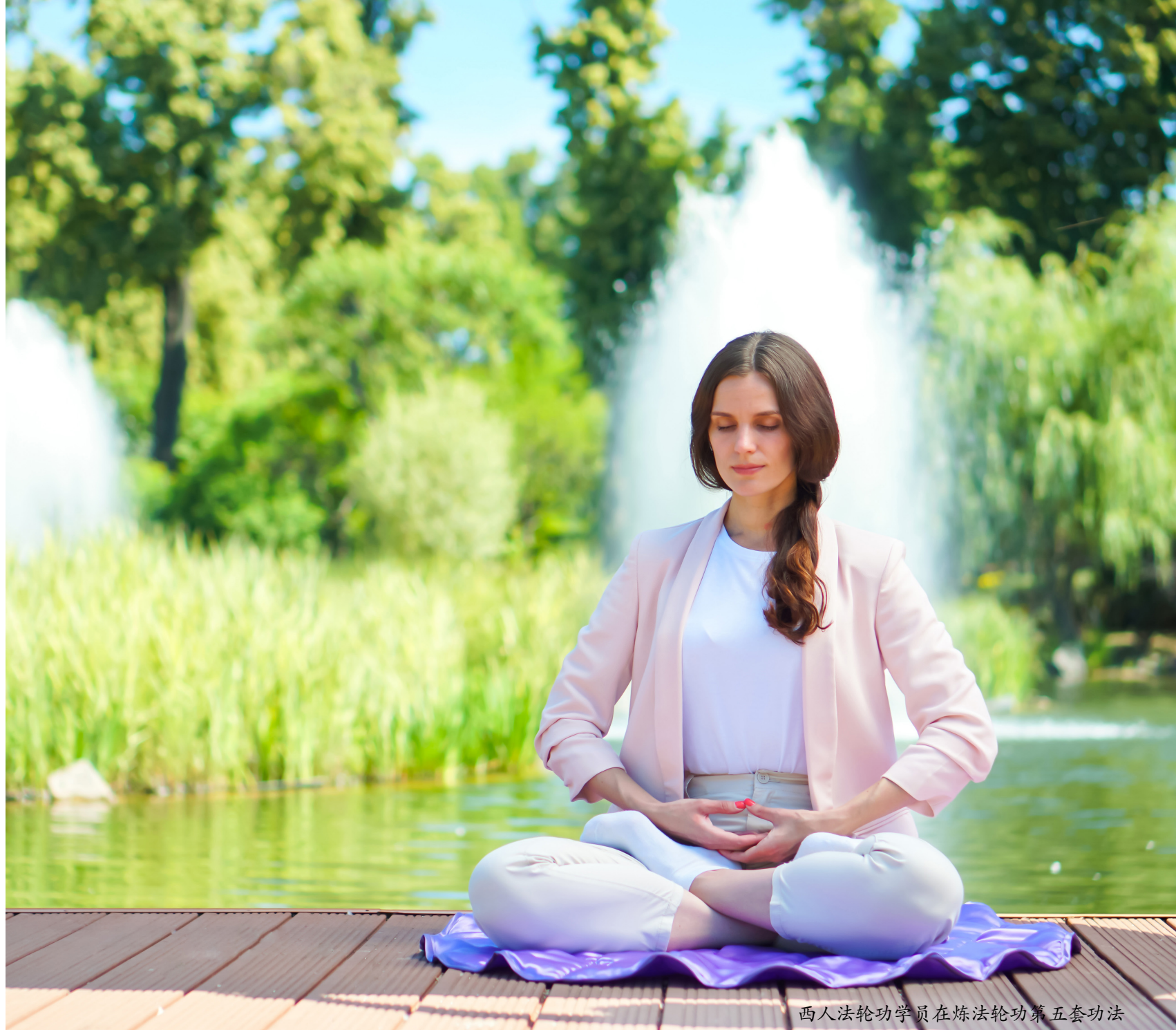
西人法轮功学员在炼法轮功第五套功法

弘传世界 法轮大法已弘传 100 多个国家和地区，受到世界人民的爱戴和尊敬。李洪志先生和法轮大法因对人类身心健康做出的杰出贡献，获各国政府褒奖、支持议案和信函 5000 多项。《转法轮》已有 40 多种文字版本，并可在法轮大法网站 (falundafa.org) 免费下载。◇