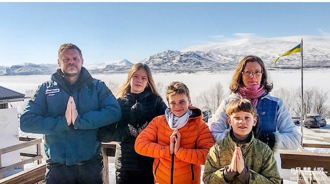
伊娃与家人在2021年5月3日向李洪志师父献上最诚挚的感恩和祝贺：“感谢师父把法轮大法传给我们！恭祝师父生日快乐！”