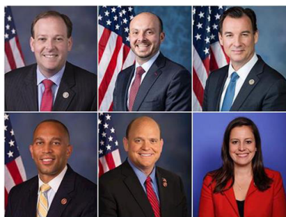
纽约州国会议员褒奖法轮功，图为发褒奖的部分议员。