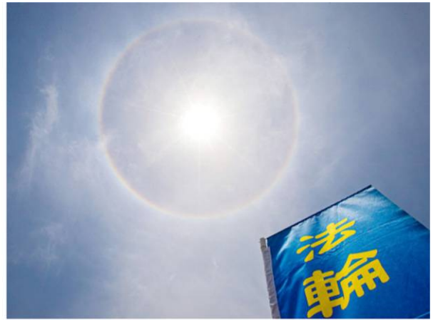
▲二零二一年五月一日，五千二百多名法轮功学员齐聚在中正纪念堂的自由广场，排字庆祝世界法轮大法日，天上出现七彩彩虹的日晕相辉映。