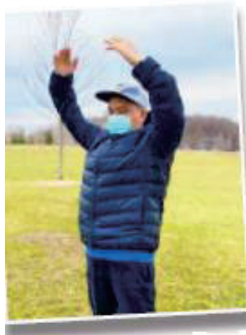
▲건강을 회복하고 파룬궁 제2장 공법을 연마하는 유씨

20일 동안 누워있었는데 유씨의 몸 무게는 160여 근에서 130여 근으로 줄었다.