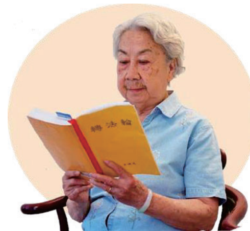
2017년 90세의 위루후이 법을 배우고 있다.

효과도 없이 두 눈이 실명됐다. 무릎과 허벅지에는 두 개의 종양이 있고, 요혈이 있어 거의 침대에 누워 있었다. 질병으로 고통받던 어머니는 뼈가 앙상하게 여위어 매일 누워만 계시는데 어디나 불편했다.