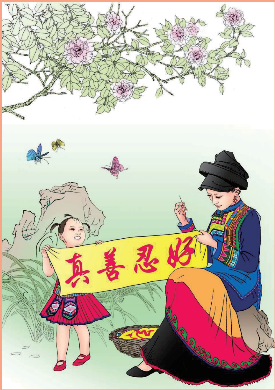
그림: 《온 세상이 함께 5.13 — 파룬따파의 날 경축》