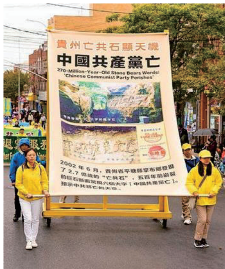
해외 파룬궁 수련생들이 시위 행진에서 귀주 “장자 석 풍경구와 문묘의 큰 전시판을 보여주고 있다.

중공이 하늘의 뜻을 거슬러 정권을 세운 후, 수많은 운동으로 8,000만 명의 중국인을 죽이고 수억 명의 중국 민중을 박해했다. 중공이 중국 전통문화, 사회 도덕, 생태환경에 대한 파괴, 중국 민중의