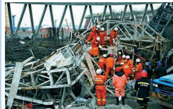
강서 풍성 발전소 냉각탑 사고 구조 현장

그날 나는 다른 두 명의 노동자와 함께 공사장에 출근했다. 도중에 나는 갑자기 창고에 나사를 가지러 가야 한다는 생각이 떠올랐고, 그 두 사람은 먼저 공사장으로 갔다. 창고에서 나와 작업장에 오자 엘리베이터를 눌렀는데 엘리베이터가 탑에서 내려간 지 이삼 분밖에 안 됐는데 갑자기 냉각탑의 시멘트 거푸집 하나가 떨어져 내려왔다. 고개를 들어 보았을 때, 순간 냉각탑 위의 근로자, 거푸집, 시멘트, 철근, 삼각대가 빙빙 돌면서 수탑으로 추락했다.