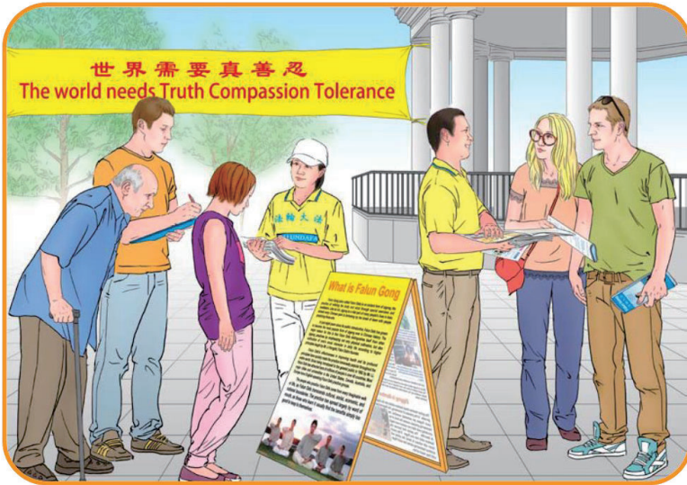
그림: <세계는 진선인(真善忍)이 필요하다>