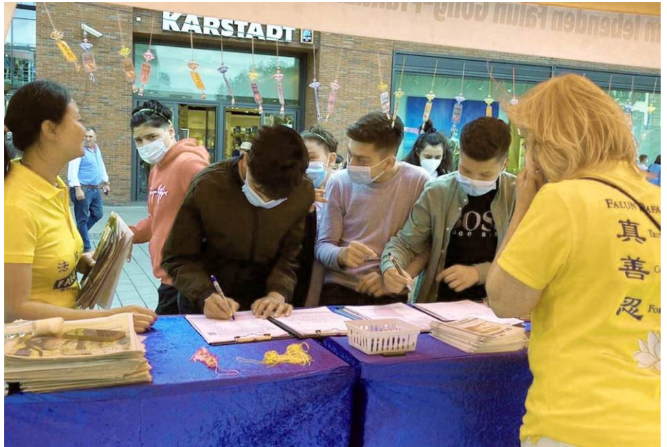
民众为反迫害签名