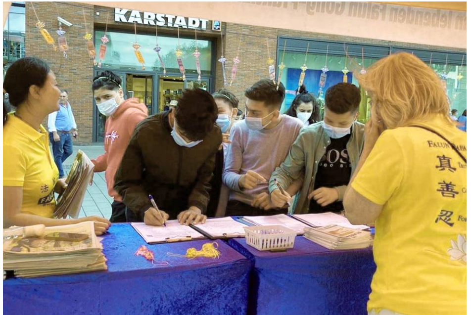
民众为反迫害签名