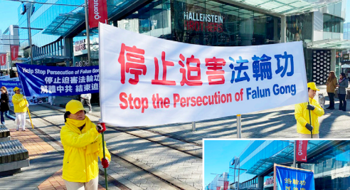
新西兰法轮功学员在基督城市中心游行反迫害