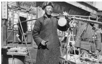
民国时期的 赊刀人旧照