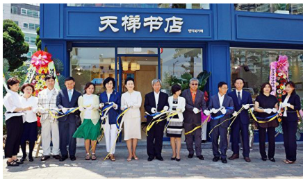
2015年7月1日，天梯书店亚洲第一分店在韩国首尔开业。图为当天的开业剪彩仪式。