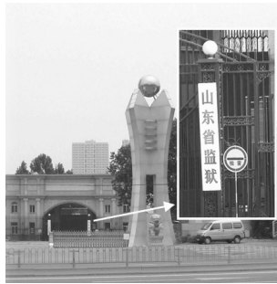
▲图为山东省监狱大门

【明慧网】山东省监狱位于济南市历下区工业南路 91 号，在带有高压电网的大墙，有荷枪实弹武警看守的监狱内，可看见一幢白色的五层楼房，这是山东省监狱十一监区，专门迫害法轮功学员的地方，是中共 610 专门为迫害法轮功而拨专款征用土地而建造的。这幢白色楼的每个窗户外都安装了固定的白色的金属百叶窗，山东省监狱其它大部份监区楼房都没有安装这种百叶窗。白色楼房室内终年不见天日，让人倍感阴森恐怖。白色的楼房、白色的百叶窗下笼罩着红色的高压恐怖，封闭着一切迫害法轮功学员的信息。