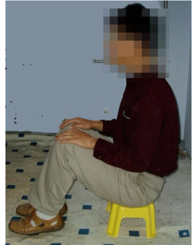
◀ 酷刑演示：做小板凳

坐小板凳是中共警察迫害法轮功学员常用的手段，被逼迫坐小板凳的法轮功学员要挺胸、收腹，两眼目视前方，两脚后跟并齐，双手放在膝盖上，不得左右挪动而只按所谓标准姿势坐着。