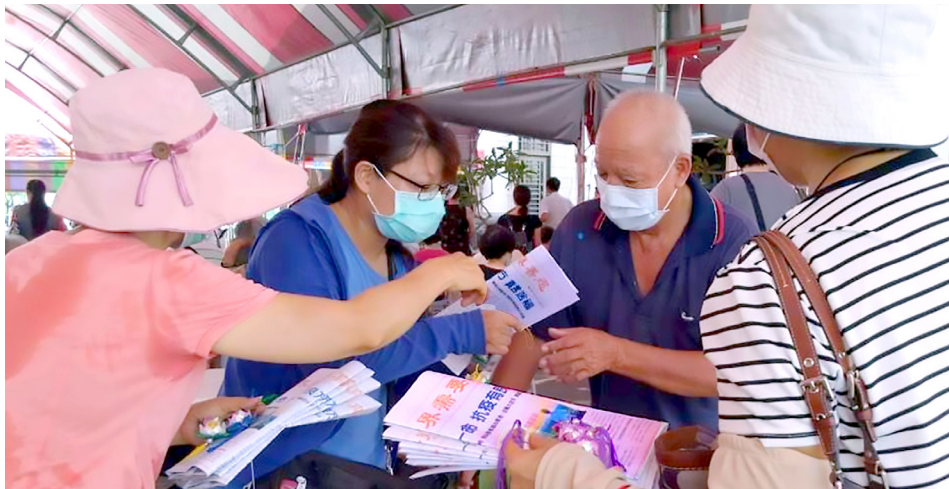
▲ 今年7月嘉义县法轮功学员派发特刊，告诉人们诚念“九字真言”会带来平安福报。

疫情缓和的台湾今年初渐趋严峻，政府升高防疫层级。在全台三级防疫警戒期间，法轮功学员义务承担防疫工作，同时传递避疫良方，受到民众的赞许与感谢。