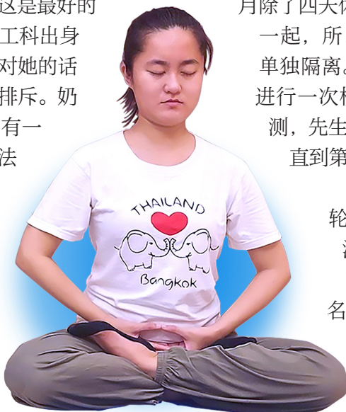
▲ 琮予在炼法轮功第五套功法

惊险过后，先生对法轮大法心悦诚服，感谢大法在危难时刻保护了自己。回台湾后，他也报名参加了学习班，并阅读了宝书《转法轮》，明白了法轮大法是教人修心向善，返本归真的高德大法。