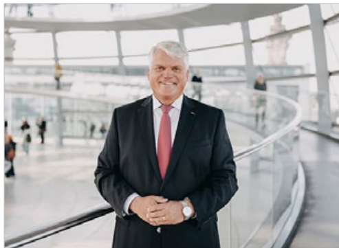
德国政府宗教自由专员格鲁伯 2021 年 7 月以政府名义发布公告，要求中共停止迫害法轮功。

报导说：“法轮功学员生活态度积极，为社会无私付出。郭先生现在很幸福，当然他也有一丝心痛，那就是他已经 12 年没能回故乡与亲人们团聚了。”