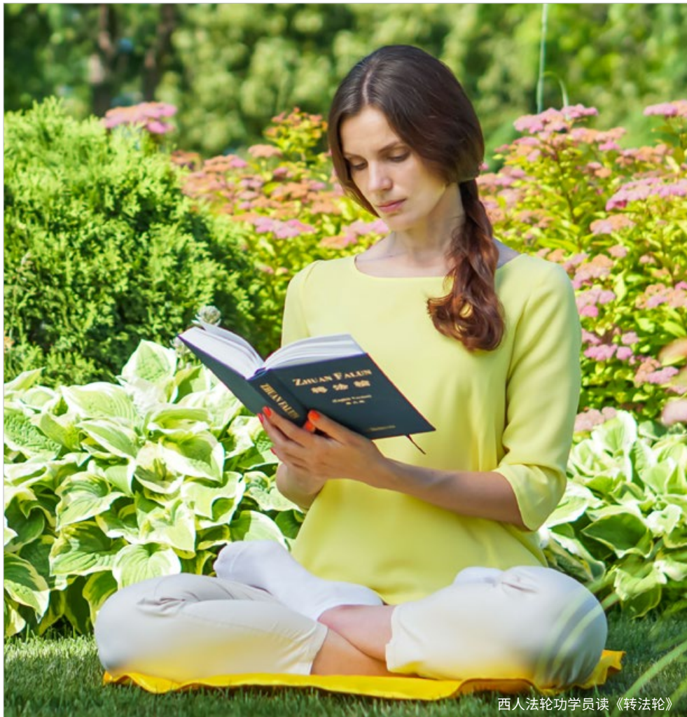
西人法轮功学员读《转法轮》