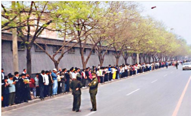
1999年4月25日上访的法轮功学员秩序井然，两名警察在一旁悠闲站立。