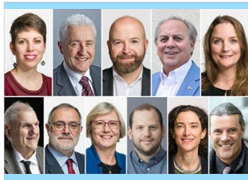
瑞士 110 名政要祝贺法轮大法传世 29 周年，贺信中说：世界需要“真善忍”以面对逆境。

令人称奇的是，丹妮丝是密切接触者，时常以拥抱的方式与失智老人沟通，却是没染疫的三人之一。主管表示，丹妮丝正面、友善的工作态度，对大家有很大的帮助。