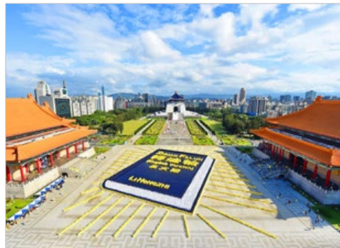
5000 多名法轮功学员在台北排组《转法轮》英文版书模。此书已被译成 40 种语言。

奥勒尔的童话《莲花的故事》获得大量积极反馈，目前在线提供 34 种语言版本。童话中提及的“三件珍宝”和她对儿童教育的体悟，都来自她 2001 年开始修炼的法轮大法“真善忍”。修炼后，她学会了正面看待一切问题，她说：“遇到困难时，不应责备别人，而是改变自己，这也会在一定程度上改变周围的环境。”她的身体也在修炼法轮功后变得健康，椎间疝引发的脊柱疼痛奇迹般地消失了。