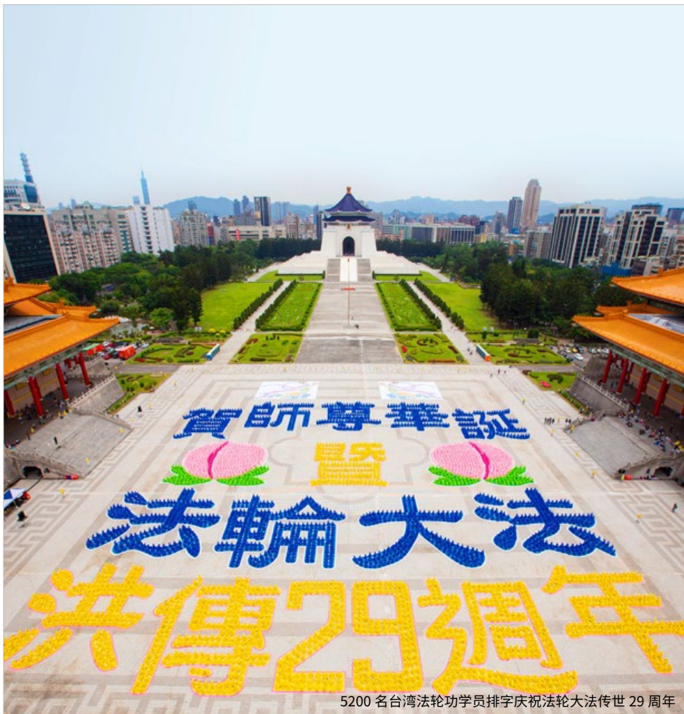
5200 名台湾法轮功学员排字庆祝法轮大法传世 29 周年