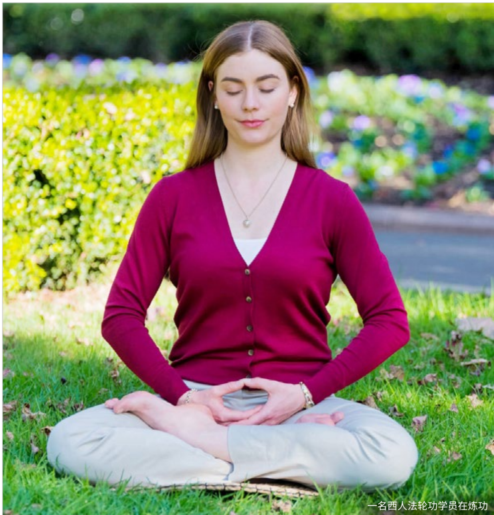
一名西人法轮功学员在炼功