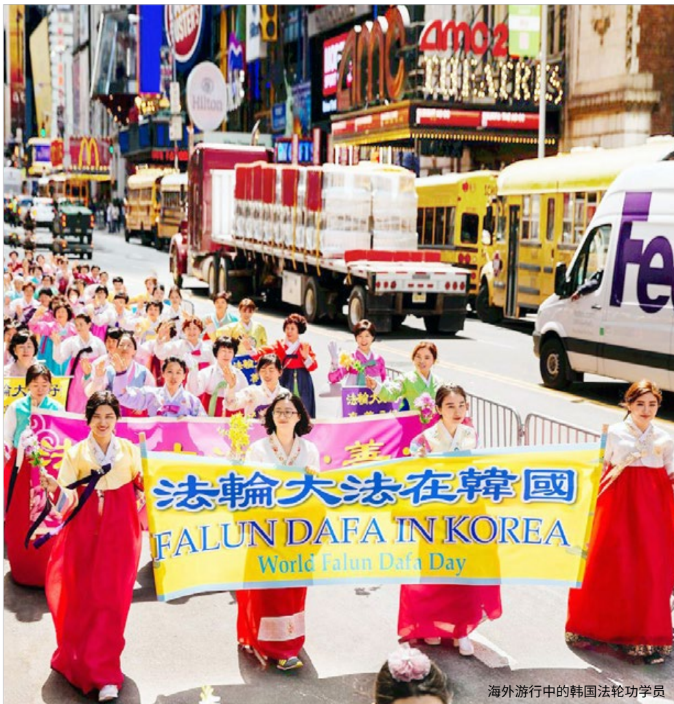
海外游行中的韩国法轮功学员