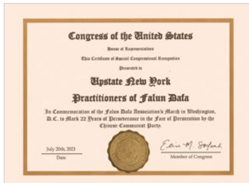
美国国会众议院 2021 年 7 月颁发特别表彰，以铭记法轮功学员面对中共迫害，坚守 22 年。