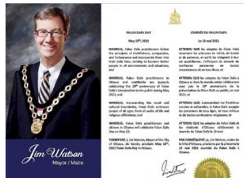
加拿大首都渥太华政要赞扬法轮功学员促进社会道德回升。图为市长吉姆·沃森的褒奖。