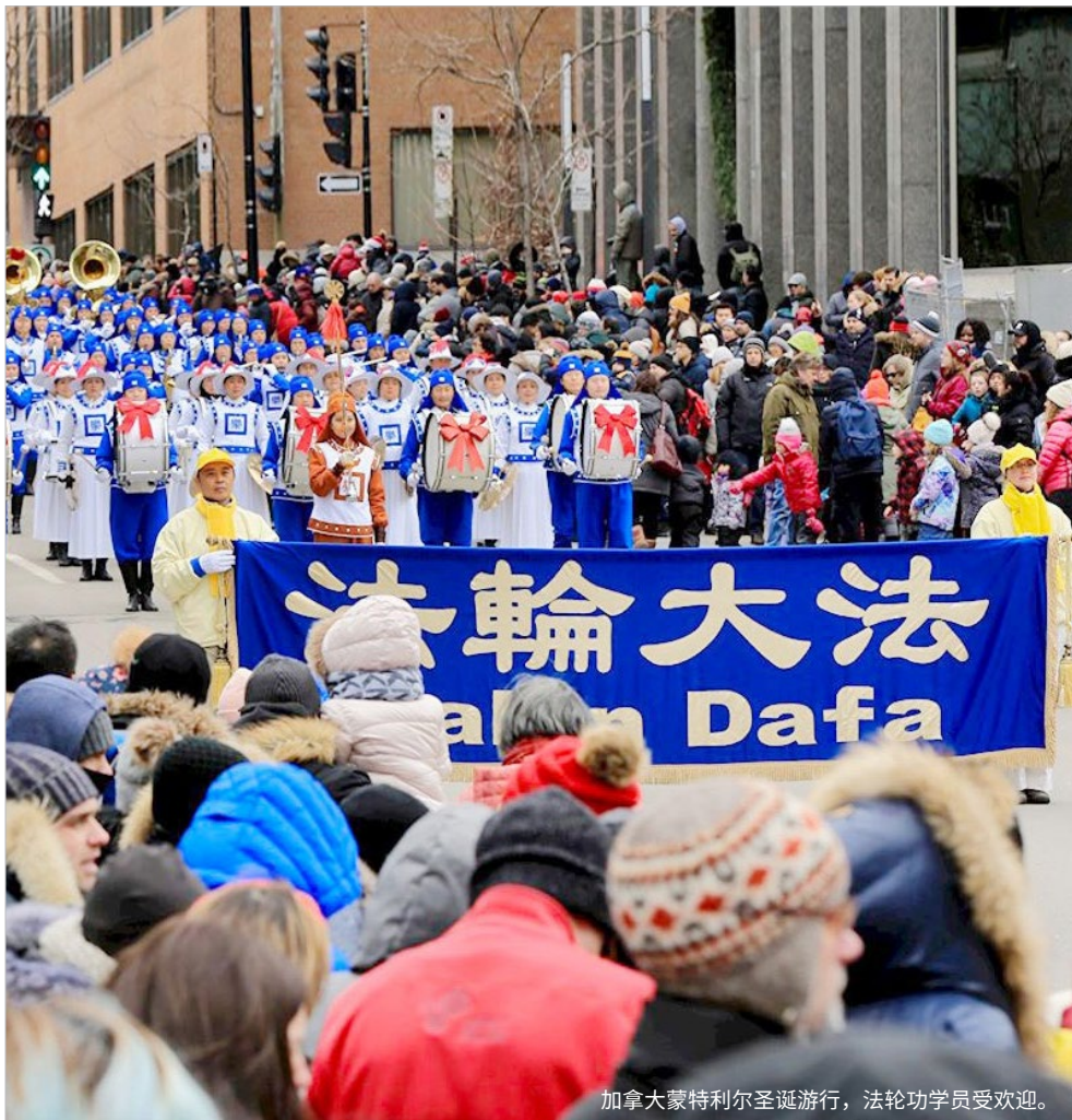
加拿大蒙特利尔圣诞游行，法轮功学员受欢迎。