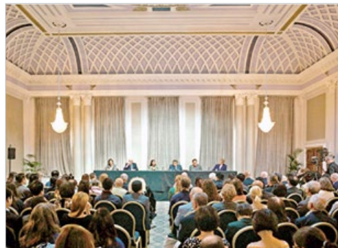
2021 年 2 月英国立法抵制中共强摘良心犯器官。独立法庭此前裁定中共犯下反人类罪。