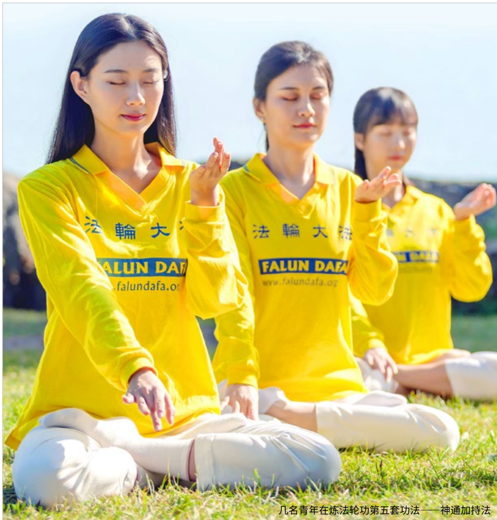
几名青年在炼法轮功第五套功法——神通加持法