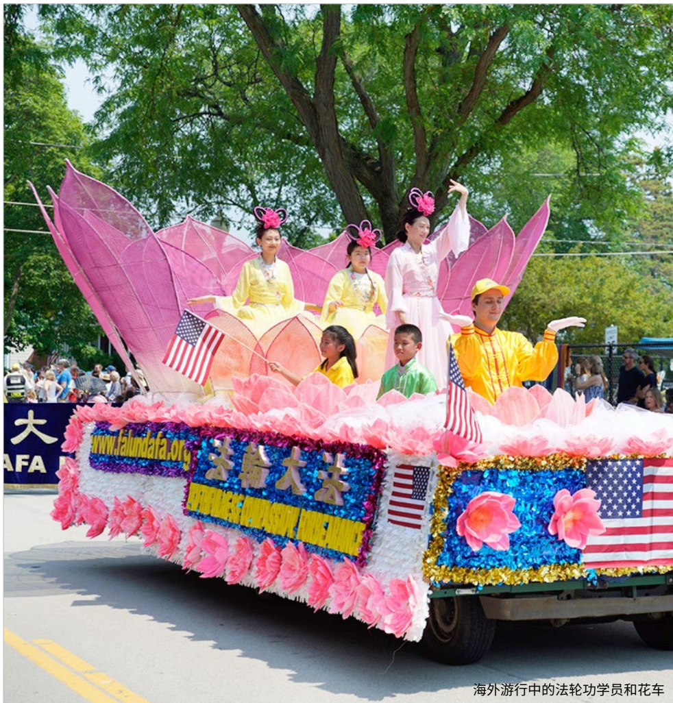
海外游行中的法轮功学员和花车