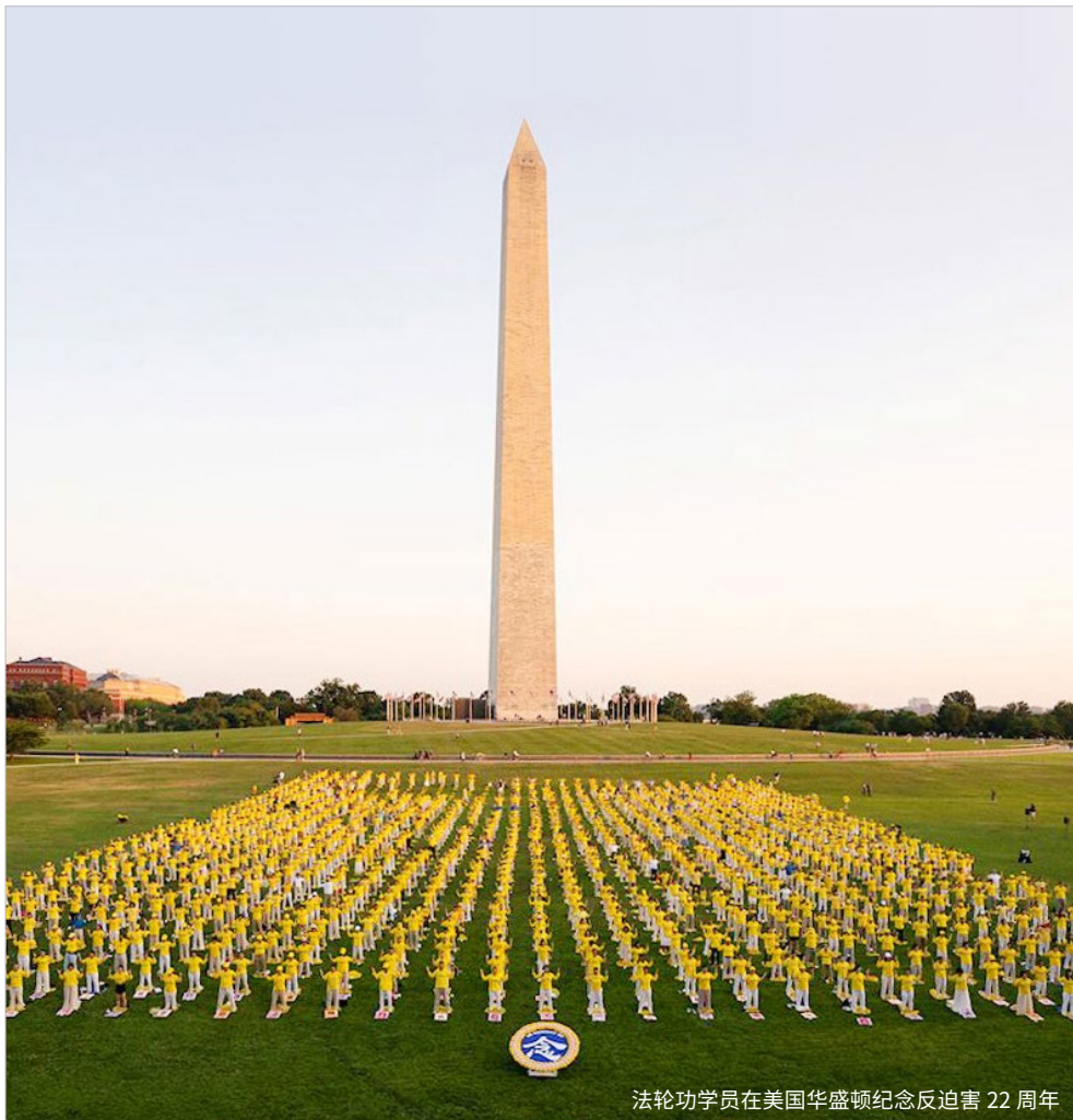
法轮功学员在美国华盛顿纪念反迫害 22 周年