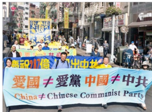
海外的真相横幅：爱国不等于爱党，中国不等于中共。“三退”是爱中国，是顺天意。