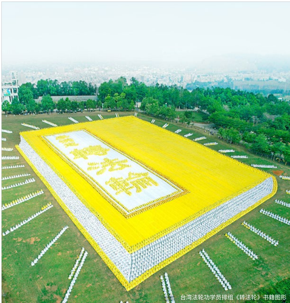
台湾法轮功学员排组《转法轮》书籍图形