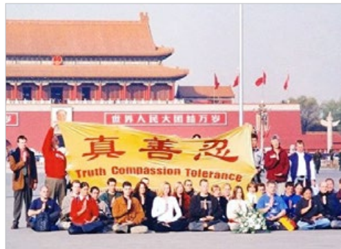
历史图片：2001 年 11 月 20 日，36 名西人法轮功学员在天安门广场展开“真善忍”横幅。

她举例说：“2020 年我生孩子时出现难产，在产床上我不停地念诵‘法轮大法好’，最后出现奇迹，不必剖腹产，母子平安！”2021 年 5 月 1 日，李娟特意抱着儿子来参加“5 月 13 日世界法轮大法日”的庆祝活动，感恩师父。她也祝愿人们记住“法轮大法好，真善忍好”，健康平安！