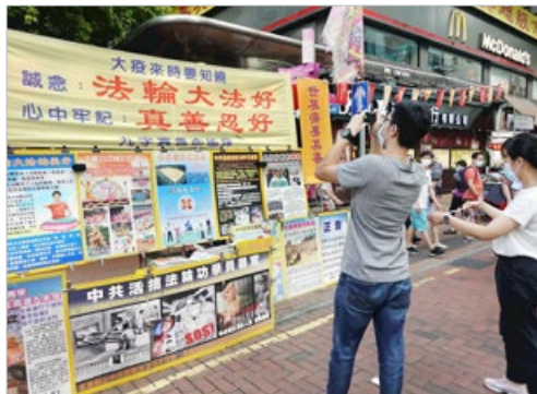
1999 年 7 月中共迫害法轮功后，香港法轮功学员长年坚持讲真相，成为一道特殊景观。