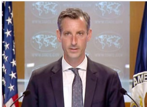
美国国务院发言人普莱斯 2021 年 7 月 19 日发表声明，要求中共立即停止迫害法轮功。

在国内，对政法委、公安系统实行“倒查 20 年”，迫害者纷纷被清算，表明中共江泽民集团迫害法轮功已经走到末路。这是迫害“真善忍”行不义的恶果，也是天意的展现。