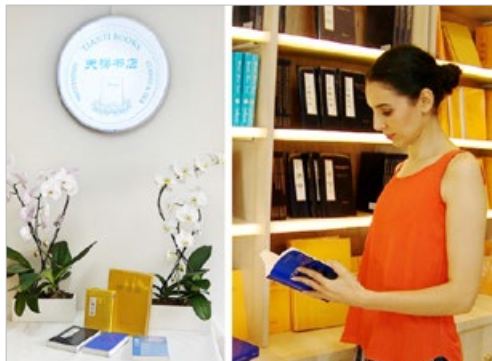
欧洲第一家天梯书店（法轮大法书籍专营店） 2021 年 6 月在巴黎开业，人们慕名而来。

“法轮功‘真、善、忍’的修炼原则，让我做到在矛盾中找自己的不足，这样，餐馆员工之间的矛盾也少之又少了。我始终相信《转法轮》中讲的：‘物质和精神是一性的。’每天心怀善念，开心地工作，做出的餐食才是最美味的。餐馆口碑颇丰，各界名流包括三位加拿大总理也多次光临。”