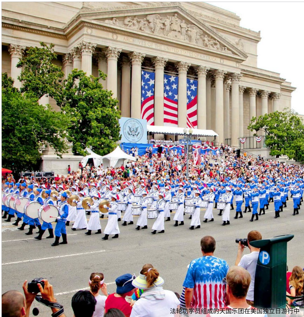
法轮功学员组成的天国乐团在美国独立日游行中