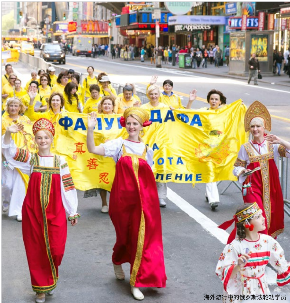
海外游行中的俄罗斯法轮功学员