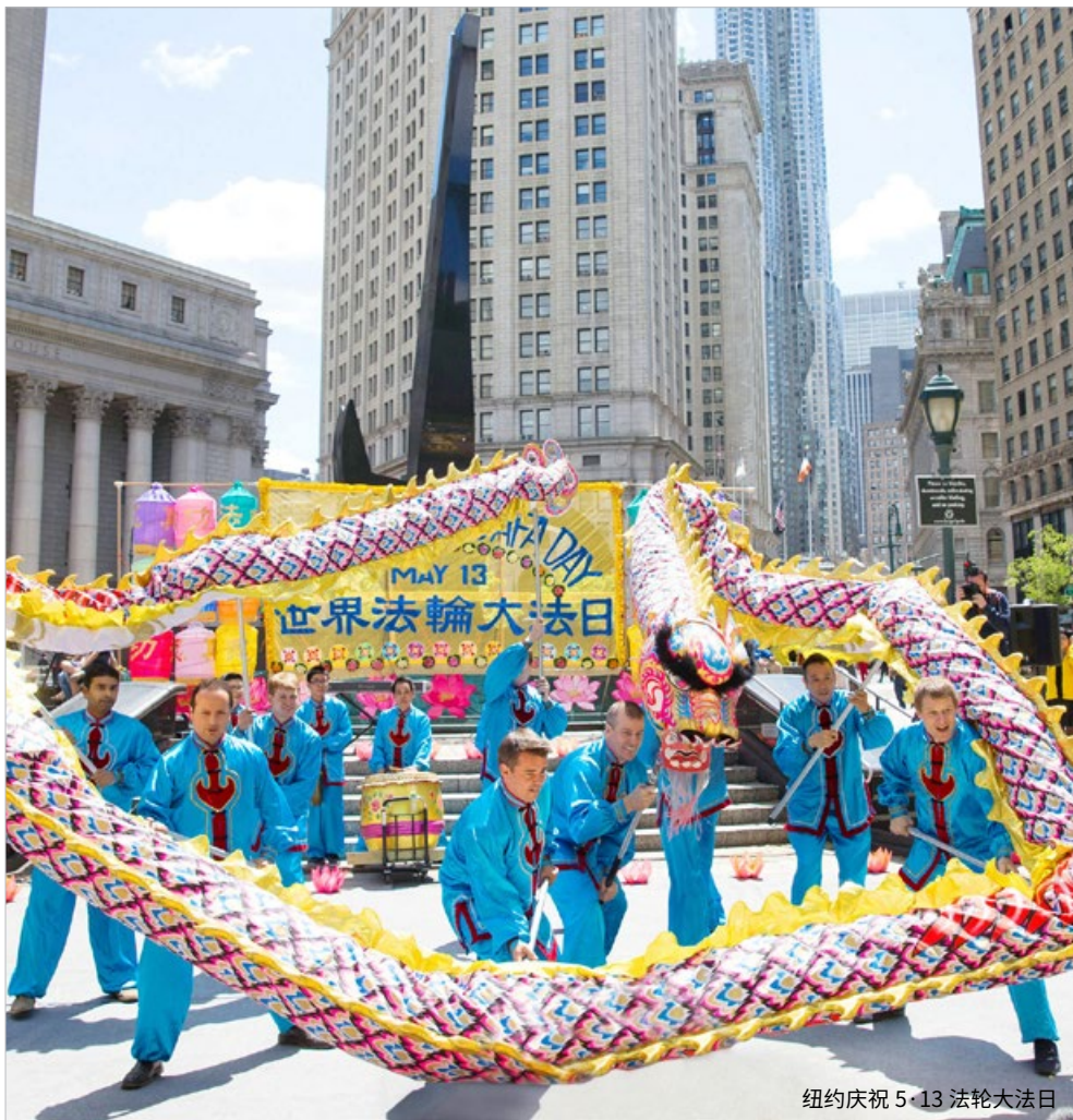
纽约庆祝 5·13 法轮大法日