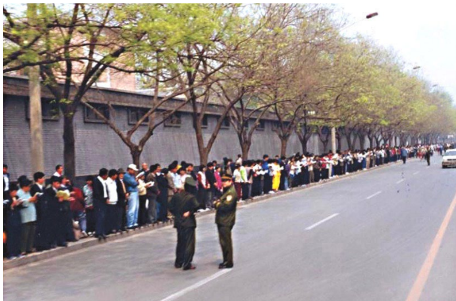
“天津事件”导致万名法轮功学员北京上访。图为秩序井然的上访现场，上访者安静地站立或读书，警察不用维持秩序，在一旁聊天。

1999年4月11日，何祚庥在天津教育学院办的《青少年科技博览》杂志上，发表题为《我不赞成青少年练气功》的文章，引用不实事例污蔑法轮功。天津法轮功学员到教育学院反映情况。4月23日和24日，天津市公安局动用300多名防暴警察殴打驱散反映情况的学员，抓捕45人。随后学员去市政府反映警察抓人的事，被告知“天津管不了，你们到北京去上访吧”。导致4月25日的北京万人大上访。当日，国家总理出面责成信访办接待法轮功