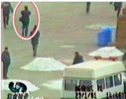
“自焚”属突发事件，又在敏感之地天安门，一般人无法在警察身边近距离拍摄。但央视自焚节目中，却有大量远景、近景和特写镜头，还可看到一名背摄影包的男子，在军警中间自由拍摄。