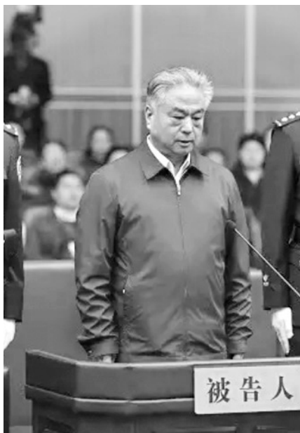
引发法轮功万人和平上访的天津市公安局局长武长顺，2017年被判死缓，终身监禁不得减刑和假释。

市大街小巷再次传出鞭炮声，亦有大量市民吃喜面庆祝。丧事被百姓当作喜事办，也是张立昌的另类报应吧。