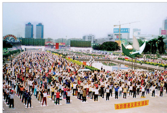
◎广州一个炼功点在晨炼。1999年前的清晨，这样的集体炼功场面遍布大陆每个城市乡村。