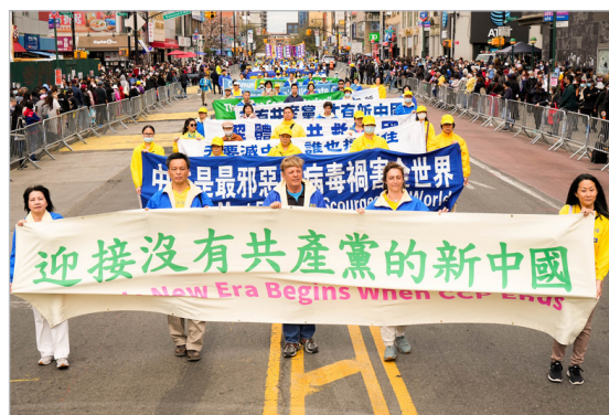
◎法轮功学员举行盛大游行，呼吁中国民众认清中共，脱离中共邪灵的控制，选择正义和良知。