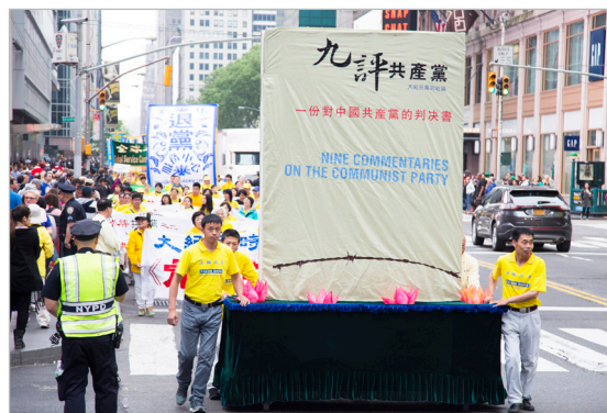
◎《九评共产党》揭露了中共的黑暗历史与邪恶本质及它给中华民族带来的深重苦难与危机。

有一天，这位政法委书记给了我一张折起来的纸。我打开一看，啊，原来是一份十多个人的“三退”名单。显然是《九评共产党》及法轮功真相资料让他彻底醒悟，他就劝说自己的亲友们做了“三退”（退出中共党、团、队）。