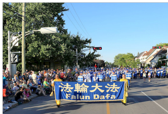
◎法轮功学员组成的天国乐团，经常受邀参加加拿大各大城市的庆典活动，受到民众的喜爱。

炼法轮功多年，他感到自己为人处世更平和了，没有了以前的急功近利，很多事情，反而能达到更好的效果。