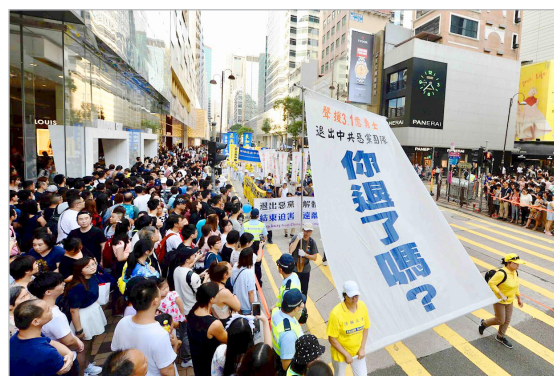
◎盛大游行中“你退了吗？”的巨幅标语，不仅震撼香港中外游客，也成为华人中的流行语。