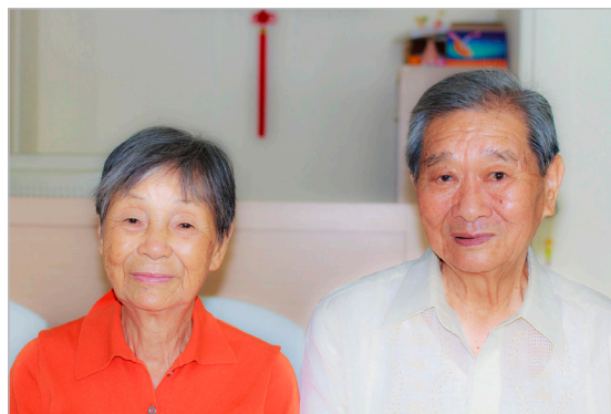
◎尤老夫妇说，暮年入道得法，实乃人生大幸。看开放下，无病一身轻，是修炼带来的福气。