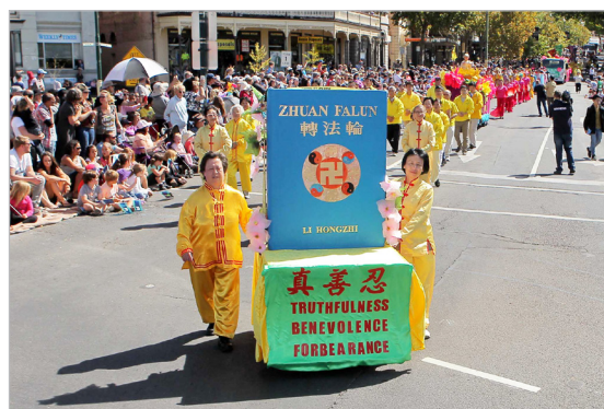
◎澳洲法轮功学员连续22年受邀参加各大城市的庆典活动。《转法轮》受到各族裔人们喜爱。