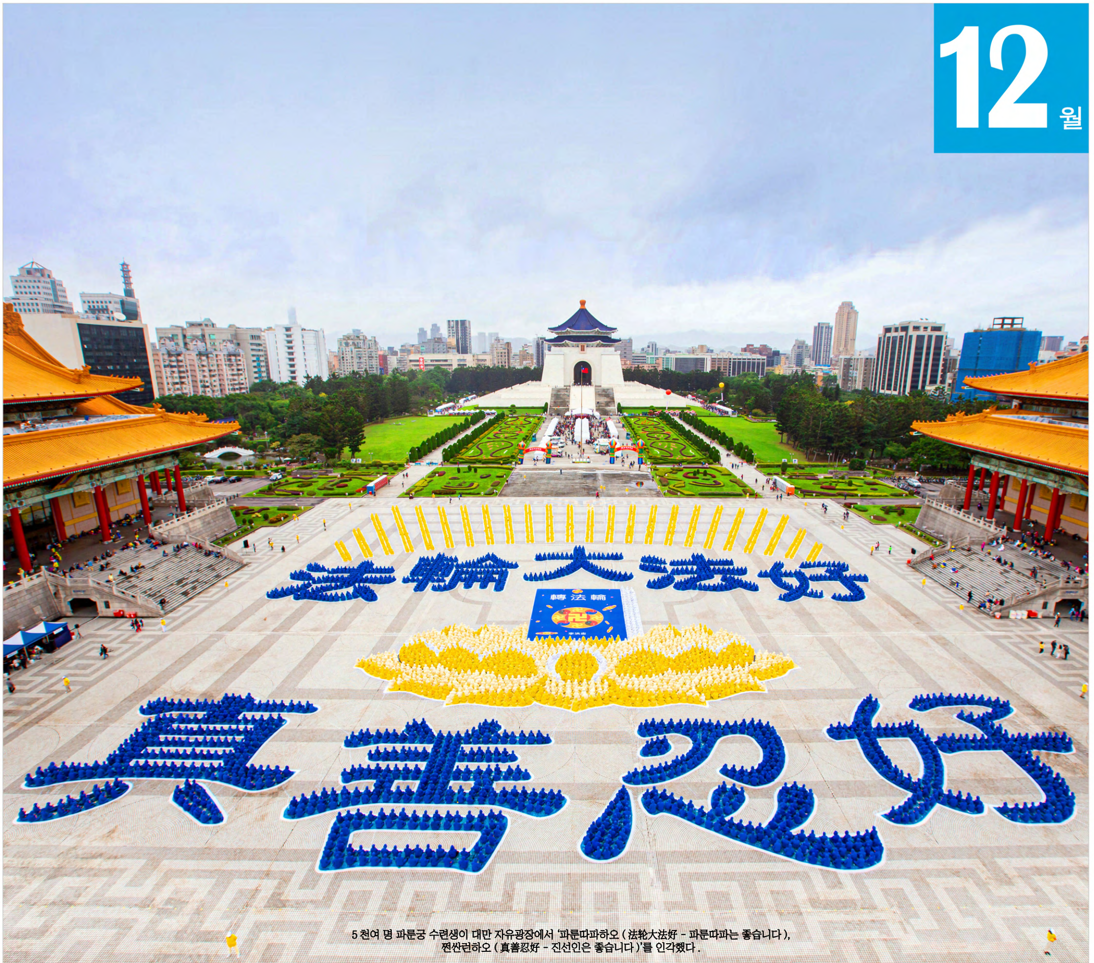
5천여 명 파룬궁 수련생이 대만 자유광장에서 '파룬따파하오 (法輪大法好 - 파룬따파는 좋습니다), 전선런하오 (真善忍好 - 진선인은 좋습니다)'를 인가했다.