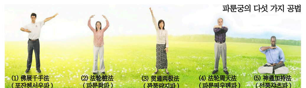
파룬궁의 다섯 가지 공법

세계에 널리 전파 파룬따파는 세계 100 여 개 나라와 지역에 전파됐으며 세계 시민의 사랑과 존경을 받고 있다. 리홍쯔 선생님과 파룬따파는 인류 심신 건강에 대한 뛰어난 공헌으로 각국 정부로부터 표창장과 지지서한 5700 여 개를 받았다.