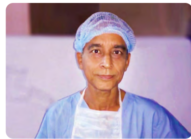
비트 박사는 “파룬따파는 내 몸의 기제 (机制)를 완전히 바꿔 놓았다”며 “60대인 내가 40대 활력을 갖게 됐다”고 말했다.

2011년 10월 친구가 그에게 파룬따파를 추천했다. 비트 박사는 당시 똑바로 누워 있지 못하고 천식으로 숨이 막혀 잠을 깨기도 했다. 파룬궁을 연마하던 날 밤, 그는 오랜만에 단잠을 잤는데 천식 증상이 사라졌다. 그는 파룬궁 사부님의 설법 녹음을 듣기 시작했다. 몇 달 뒤 무릎 관절도 더 이상 아프지 않았다. ‘진선인 (真·善·忍)’에 따라 수련하면서 그는 평화롭고 느긋해졌다. “저는 평소 잘난 척했는데 파룬따파가 저를 아주 겸손하게 만들었습니다. 사람은 자기 잘못을 인정하기 어려운데 이제는 그렇게 어렵지 않습니다.” 아내와 장모 모두 일찍이 수련한다는 그를 비웃었으나 그의 큰 변화에 깜짝 놀라 역시 파룬궁을 배우기 시작했다.