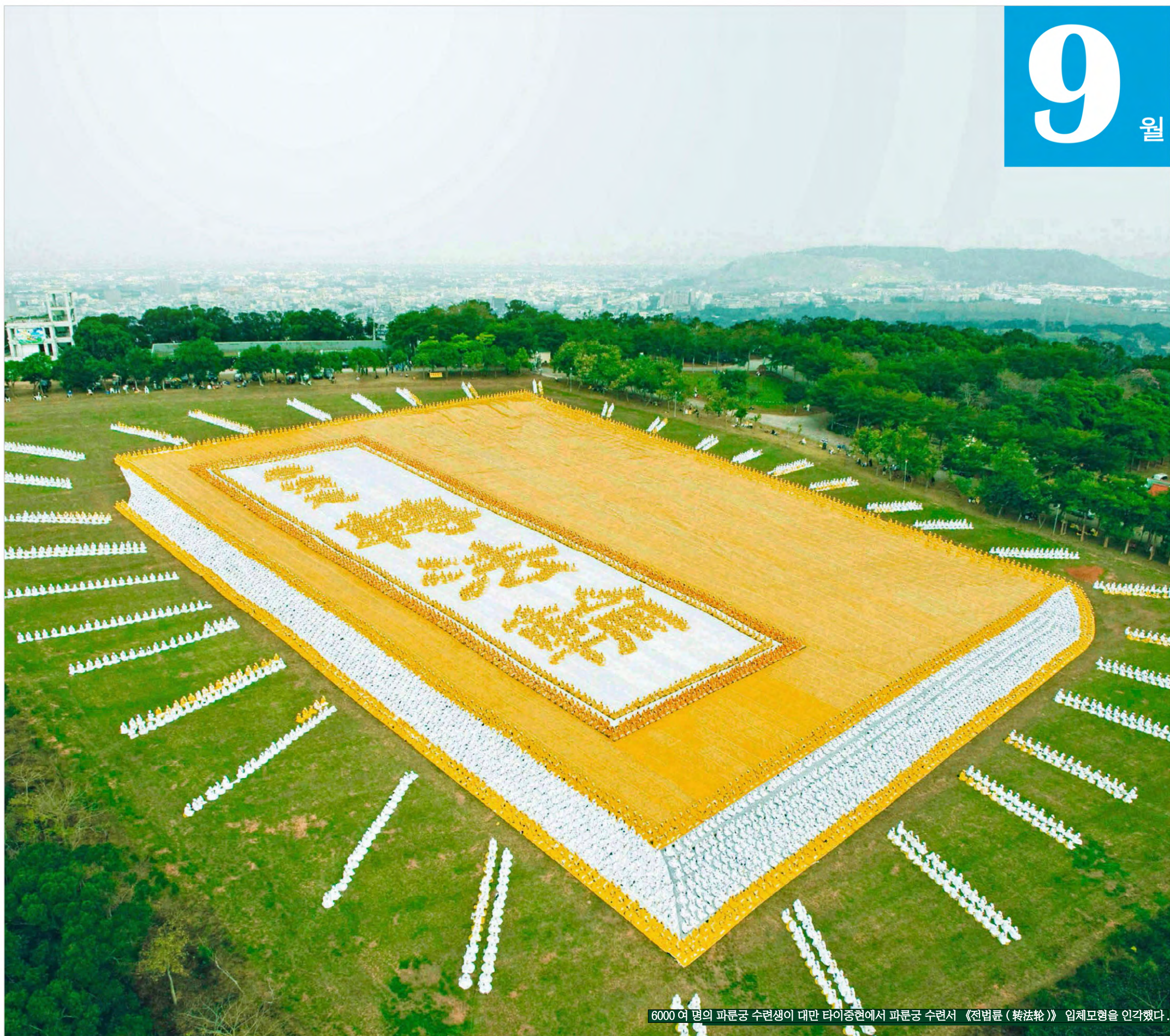
6000 여 명의 파룬궁 수련생이 대만 타이중현에서 파룬궁 수련서 《전법륜 (转法轮)》 입체모형을 인가했다.