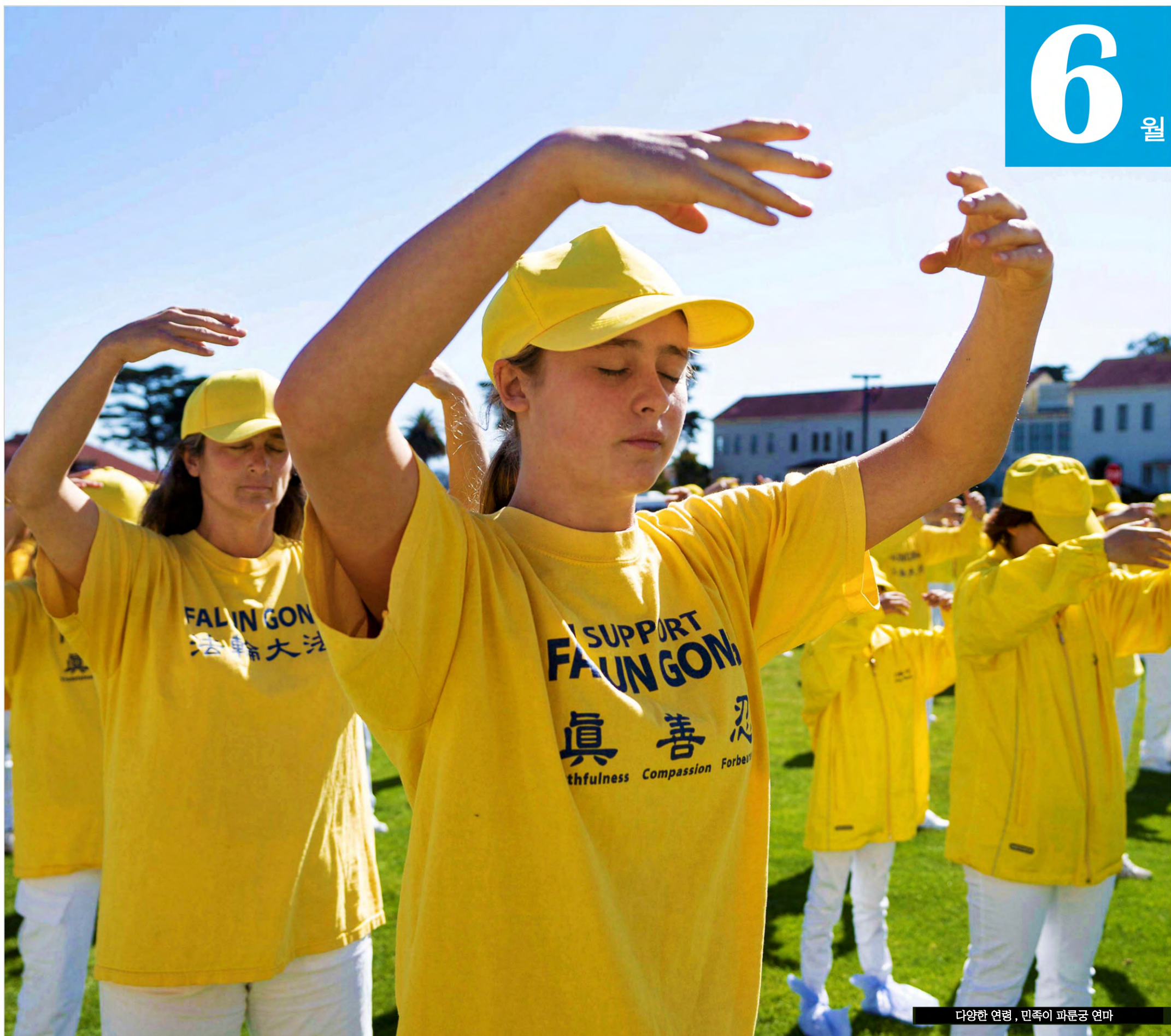
다양한 연령, 민족이 파룬궁 연마