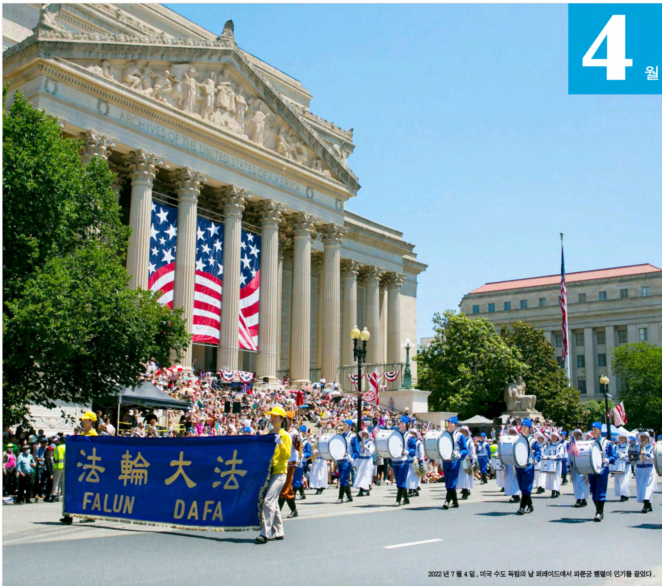
2022년 7월 4일, 미국 수도 독립의 날 퍼레이드에서 파룬궁 행렬이 인기를 끌었다.