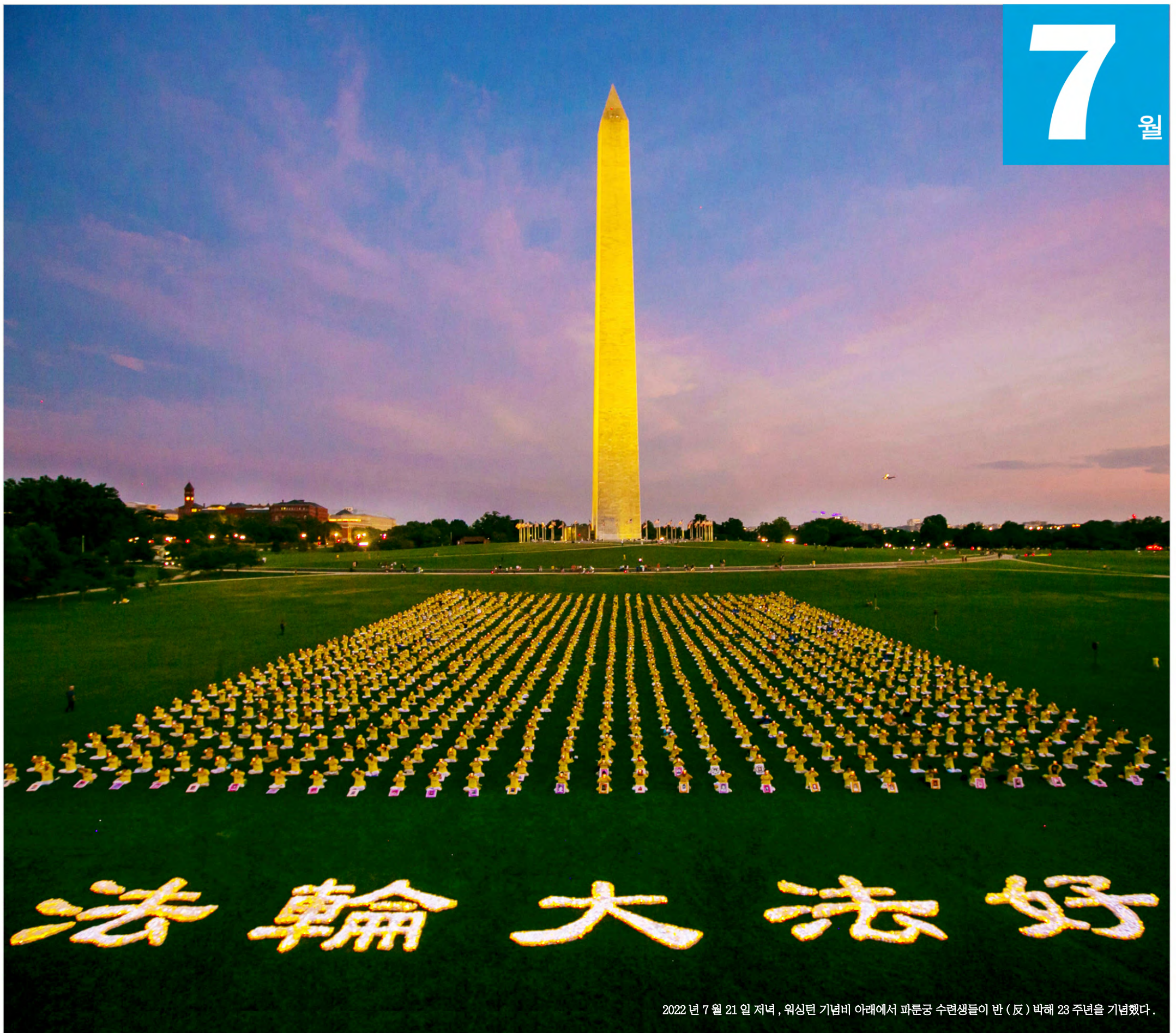
2022년 7월 21일 저녁, 워싱턴 기념비 아래에서 파룬궁 수련생들이 반(反)박해 23주년을 기념했다.