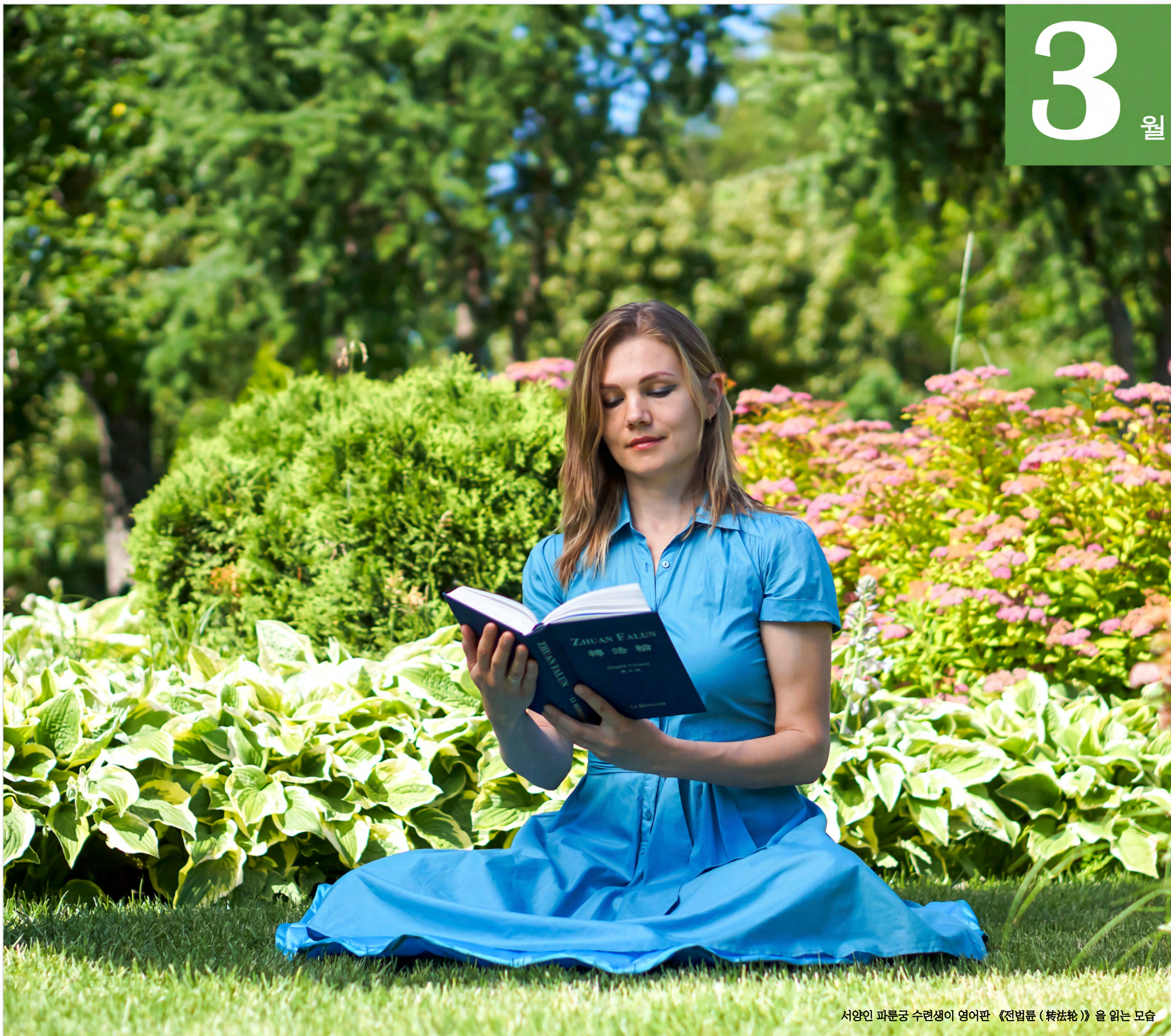
서양인 파룬궁 수련생이 영어판 《전법륜 (转法轮)》을 읽는 모습