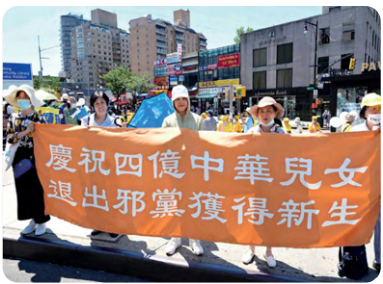
2022년 8월 3일 해외 탈당 사이트에 중공의 공산당, 공청단, 소선대에서 탈퇴를 선언한 중국인이 4억 명을 넘어섰다. 사진은 경축하고 있는 뉴욕 화인들.

베트남에서 5위 안에 드는 명문대 법학과 교수인 응우옌 웨잉 박사는 2010년 2월 의료사고로 척추에 레이저 화상을 입었다. 좋아하는 테니스도 할 수 없었고 30분 정도 앉으면 바로 누어야 했다. 슬프고 울적할 때 한 친구가 파룬따파의 주요 저서인 《전법륜(轉法輪)》을 보내왔다.