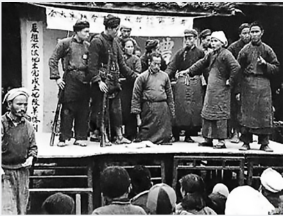
토지개혁운동 (1950~1952년) 100~200만 명이 비정상적으로 사망.(강차오 중화인민공화국사)