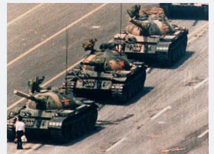
6.4도륙 (1989년) 3천7백 명이 넘는 사람이 사망(국제적십 자회)