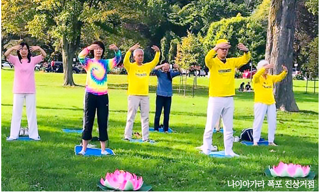
나이가가라 폭포 진상거점

황여사의 아버지는 딸에게 "공산당은 토비"라고 말해줬다고 한다. 그녀는 "오늘