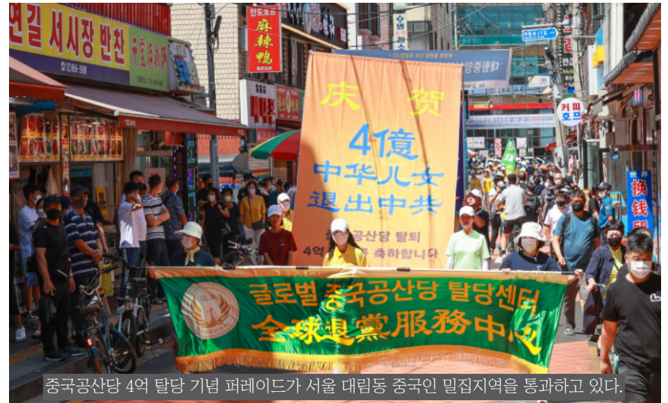
중국공산당 4억 탈당 기념 퍼레이드가 서울 대림동 중국인 밀집지역을 통과하고 있다.

대법에 대한 바른 태도로 아들은 큰 복을 받았다. 미국 명문 교양학부 중심 대학을 졸업한 뒤, 곧바로 미국 일류 대학에 진학해 석·박사과정을 밟았다. 아들의 논문은 점차 미국 일류 전문 저널에 실리고 미국 일류 언론의 주목을 받고 있다. 退