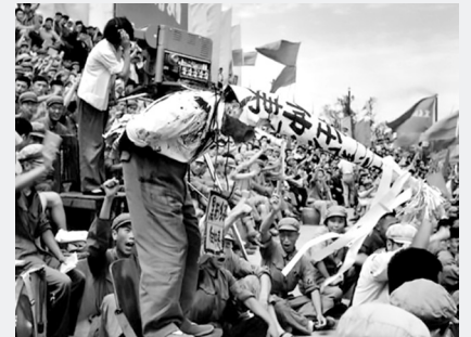
문화대혁명 (1966~1976년) 비정상적으로 733 만 명 사망[중국 현지(县志) 기재 통계]; 비정 상사망 2천만 명.[예젠잉(叶剑英) 기술]