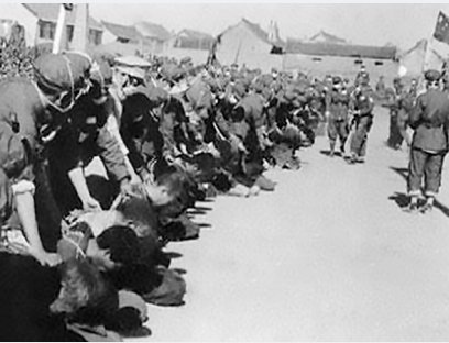
‘반혁명’ 탄압 (1950~1952년) 100만 명 살해(마오쩌둥이 ‘노산회의’에 서 발언)