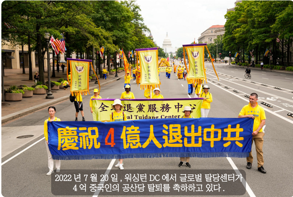
2022년 7월 20일, 워싱턴 DC에서 글로벌 탈당센터가 4억 중국인의 공산당 탈퇴를 축하하고 있다.