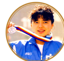
황샤오민: 올림픽 명장, 전 국가 대표 선수

기원 사이트에 공개 탈당성명을 하며 말했다. “중공 관료 집단은 기득 이익을 보호하기 위해 국가민족 대의를 돌보지 않고 민중의 지혜를 무시했으며 인권을 짓밟았다. 소위 중국특색으로 보편적인 가치에 대항했다. 부패가 횡행하고 재앙이 빈번하며 국운이 날로 쇠락하고 민생이 어렵게 되었다. 중공은 집정당으로 그 책임을 면하기 어렵다! 독재를 제거하지 않으면 재난이 그치지 않을 것이며 중공이 망하지 않으면 하늘이 용납하지 않는다!”