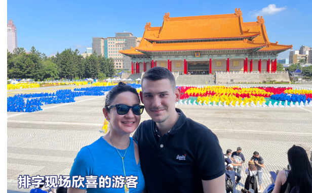
排字现场欣喜的游客