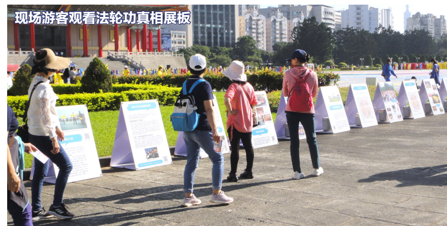
现场游客观看法轮功真相展板