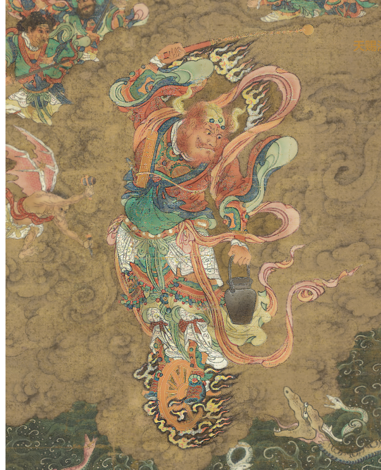
明代作品《雷公像》局部（美国大都会艺术博物馆藏）

折磨孩子的皮肤病彻底好了，没留下任何疤痕。孩子真实的样子呈现出来了，白白胖胖的。