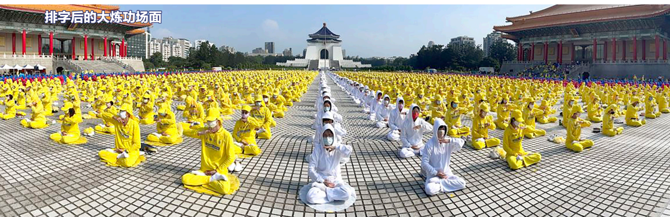
排字后的大炼功场面