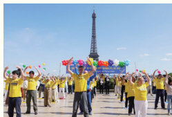
○法国议员赞誉：法轮大法理念“真善忍”，引起各族裔人们的强烈共鸣。图：法国法轮功学员在炼功。