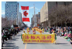
○加拿大政要赞誉：法轮大法打动无数人的心。图：加拿大法轮功学员把中华传统文化展现给了西方人。