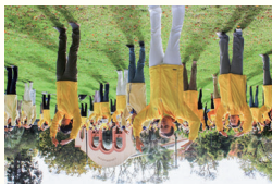
澳洲墨尔本法轮功学员在集体炼功。在澳洲，法轮功炼功点遍布各大城市及乡村，受各族裔人士喜爱。