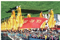
◎1998年，中国沈阳市亚洲 体育节开幕式，法轮功学员 队伍受邀参加。当年中国有1 亿人修炼法轮功。

想当初大风，刚过，就来，就这人家拼了性命。风生一出，身一抛。 『公公，后，他几个儿女都不管她。』 风生叫：『风生，我，做梦都不想你把我接回家，我，才于十七岁嫁。』