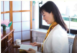
夏宁博士在拜读《转法轮》。她说：是法轮大法让我明白了人生意义，那就是“返本归真”。