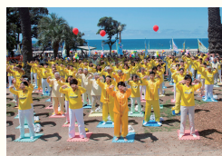
●美国洛杉矶市各族裔法轮功学员在圣莫妮卡码头集体炼功。美国50个州中有48个州有法轮功炼功点。