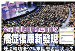
美国临床肿瘤学会年会上，癌症末期患者修炼法轮功痊愈的研究成果，引起国际医学界的关注与赞誉。