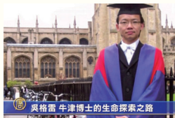
○格雷说：修心炼功，使我多年的胃病痊愈了；精神状况也变得非常好，有更加充沛的精力去做研究。