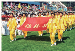
●1998年，中国沈阳市亚洲体育节开幕式，法轮功学员队伍受邀参加。当年中国有1亿人修炼法轮功。