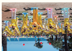
●美国洛杉矶市各族裔法轮功学员在圣莫妮卡码头集体炼功。美国50个州中有48个州有法轮功炼功点。