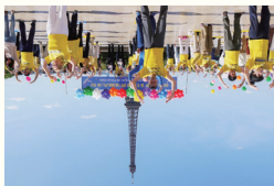
○法国议员赞誉：法轮大法理念“真善忍”，引起各族裔人们的强烈共鸣。图：法国法轮功学员在炼功。