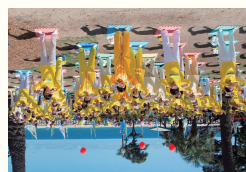
●美国洛杉矶市各族裔法轮功学员在圣莫妮卡码头集体炼功。美国50个州中有48个州有法轮功炼功点。