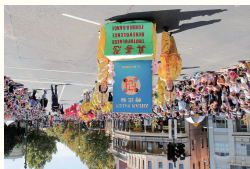
● 墨尔本法轮功学员连续22年受邀参加澳洲各大城市庆典活动。《转法轮》一书受到各族裔人们喜爱。