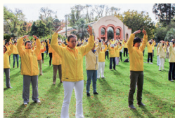
澳洲墨尔本法轮功学员在集体炼功。在澳洲，法轮功炼功点遍布各大城市及乡村，受各族裔人士喜爱。