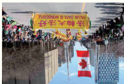
○加拿大政要赞誉：法轮大法打动无数人的心。图：加拿大法轮功学员把中华传统文化展现给了西方人。

『世』：世人都说，西方人修炼法轮功，是为了感恩这个殊胜的日子，身心受益的人们把每年5月11日定为『世界法轮大法日』。许多中西方人士都说：『世界需要真善忍！』 加拿大前总理哈珀说：『过去的20多年，全世界无数人受益于修炼法轮大法，「真善忍」引起人们的共鸣。』 美国硅谷知名企业家克里斯·纪泽，25年来创建的公市市值超过70亿美元。他说：法轮功『真善忍』的原则是永恒的，适用于指导我个人生活和事业的方方面面。 曾叱咤中国体坛的游泳名将黄晓敏，在奥运等比赛中获得十多枚金牌。然而长期超负荷训练，使她面临终身瘫痪。1999年黄晓敏修炼法轮功后完全康复，她无限感恩法轮功。许多中西方人士都说：『世界需要真善忍！』