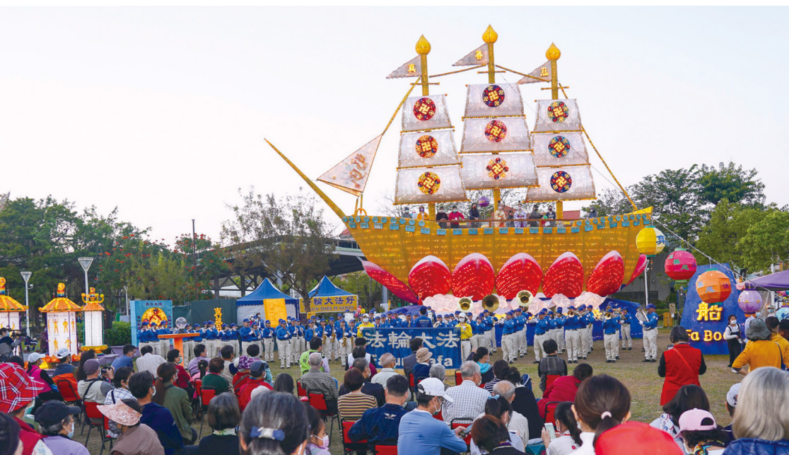
좌측 사진: 신구천차(神駒天車) 등불. 우측 사진: ‘파룬궁 다섯 가지 공법’ 등불. 아래 사진: 지난 2월 1일부터 28일까지 대형 ‘법선’ 등불이 가오슝(高雄) 강산(岡山)공원에 전시됐다. 천국악단과 요고대의 공연으로 축제 분위기가 더해졌고 수만명 민중이 참여해 법선에 올라 아름다움을 체험하고 선(善)한 염원을 발하는 전통 풍습을 즐겼다.

2022년 대만 대보름 등불 축제가 가오슝에서 성대하게 개최됐다. 대만 파룬따파 학회는 거대한 행사를 돕기 위해 백 명을 수용할 수 있는 6층 높이의 대형 ‘법선’ 등불을 제작했다. 제작된 등불