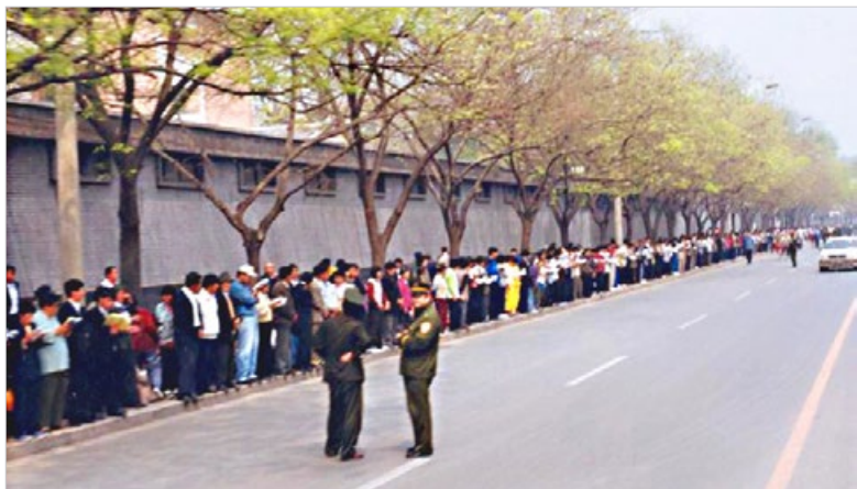
1999年4月25日上访的法轮功学员秩序井然，两名警察在一旁悠闲站立。