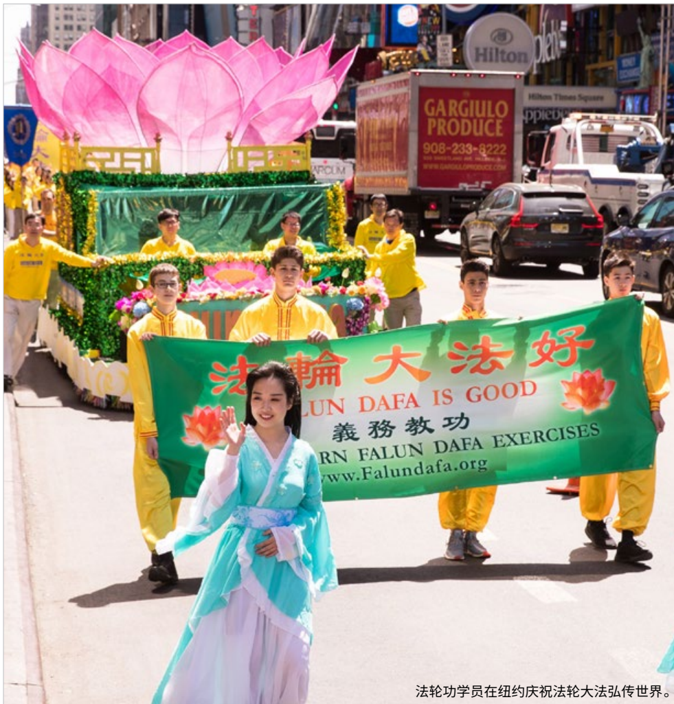
法輪功學員在紐約慶祝法輪大法弘傳世界。