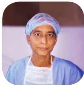
比特博士说，如今 60 多岁的他拥有 40 岁的精力。

2011 年 10 月，朋友向他推荐法轮大法。比特博士当时睡觉不能平躺，还会因哮喘窒息而惊醒。学炼法轮功的当晚，他就睡了一个久违的好觉，哮喘消失了。他开始聆听法轮功师父的讲法录音。几个月后，膝关节不再疼痛。按照真、善、忍修炼，以前说一不二的他变得平和而宽容，他说：“我以前自以为是，法轮大法让我谦逊了很多。人很难承认自己的错误，现在我不觉得那么难了。”太太和岳母都曾因为他学了一种新的功法而笑话他，看到他的巨变，既震惊又信服，也开始学法轮功。