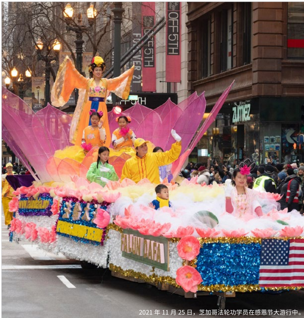
2021 年 11 月 25 日，芝加哥法轮功学员在感恩节大游行中。