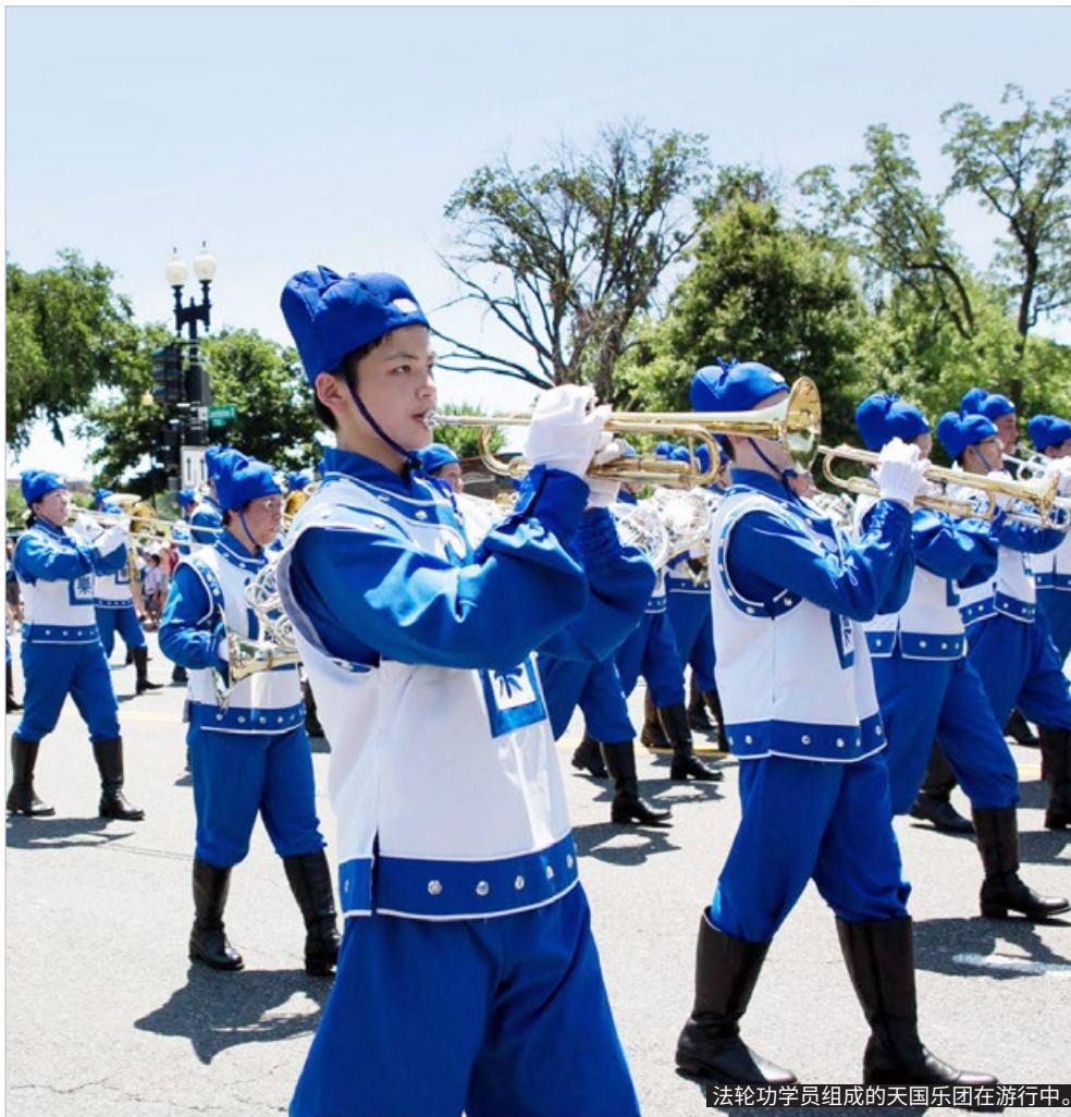
法轮功学员组成的天国乐团在游行中。