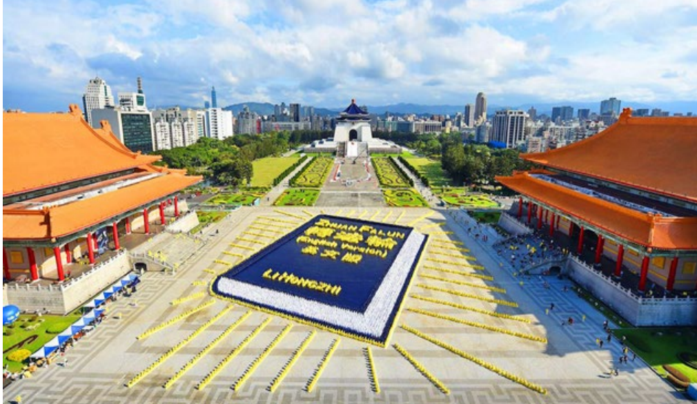
5000 多名法轮功学员在台北自由广场排出《转法轮》英文版的书籍模型，场面壮观殊胜。