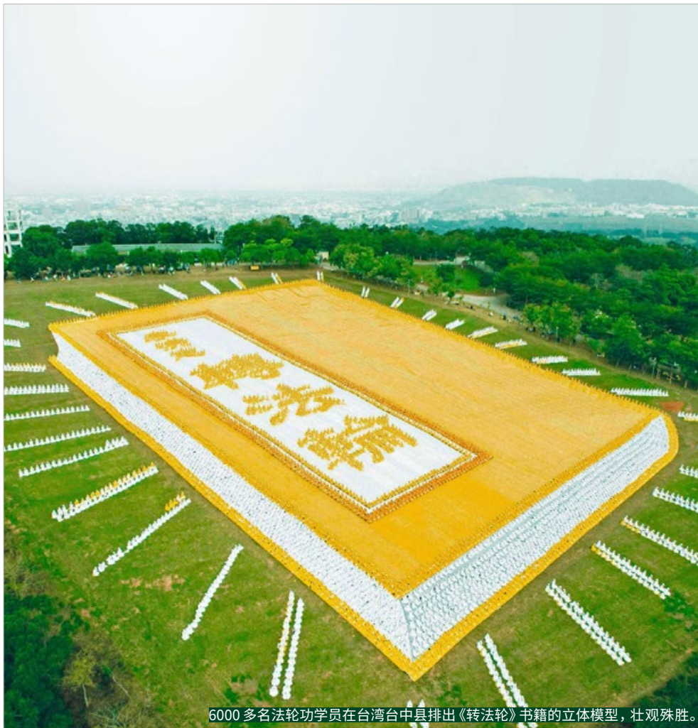
6000 多名法轮功学员在台湾台中县排出《转法轮》书籍的立体模型，壮观殊胜。