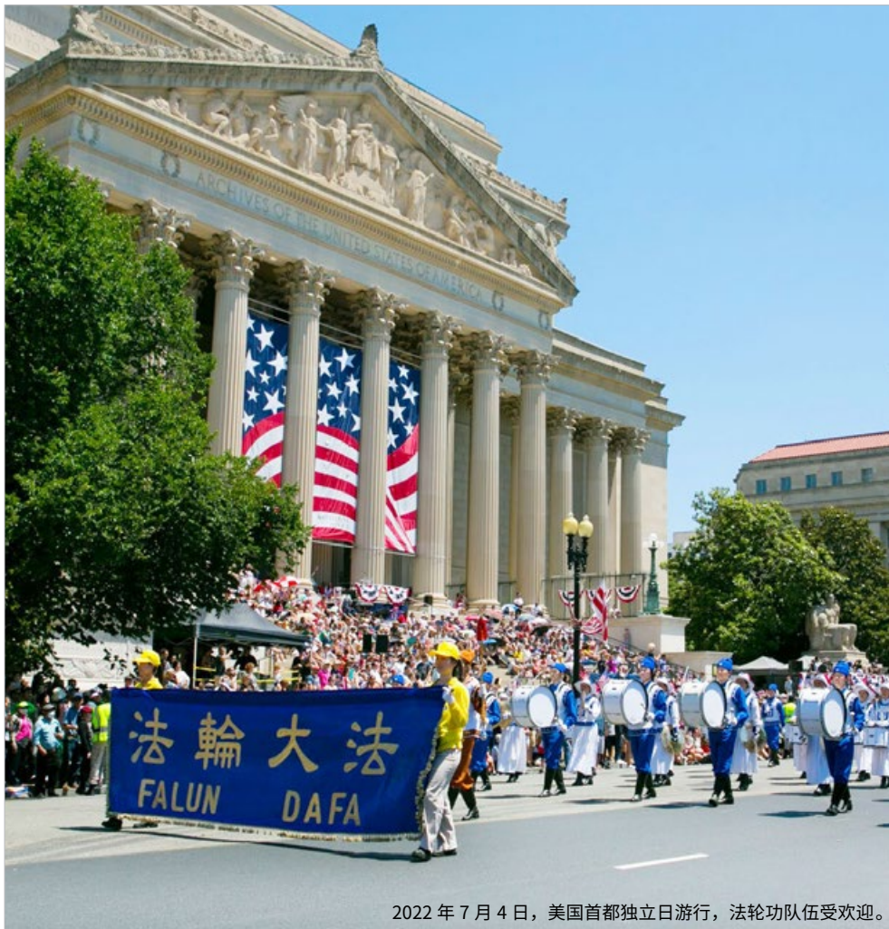
2022 年 7 月 4 日，美国首都独立日游行，法轮功队伍受欢迎。