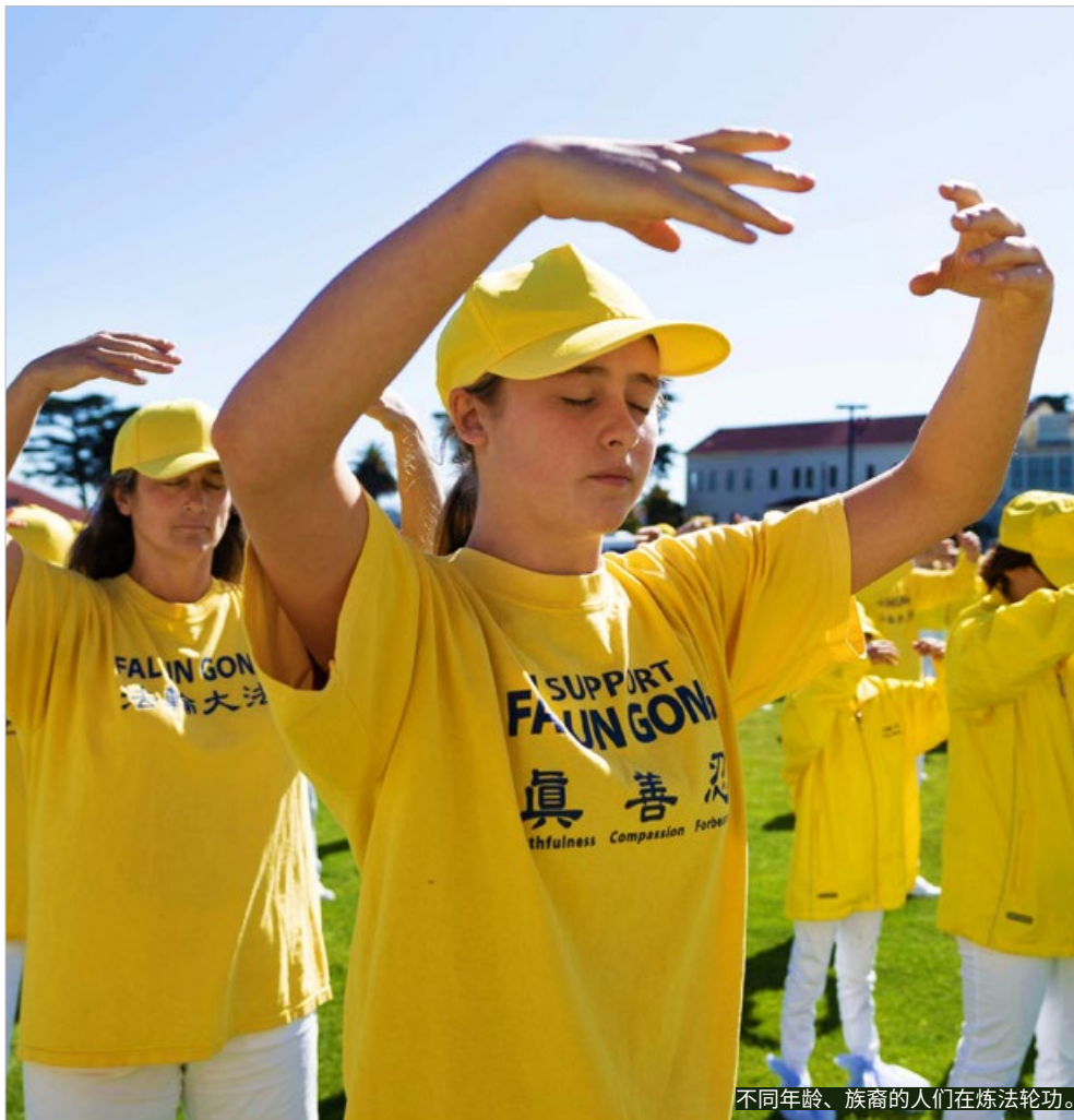
不同年龄、族裔的人们在炼法轮功。