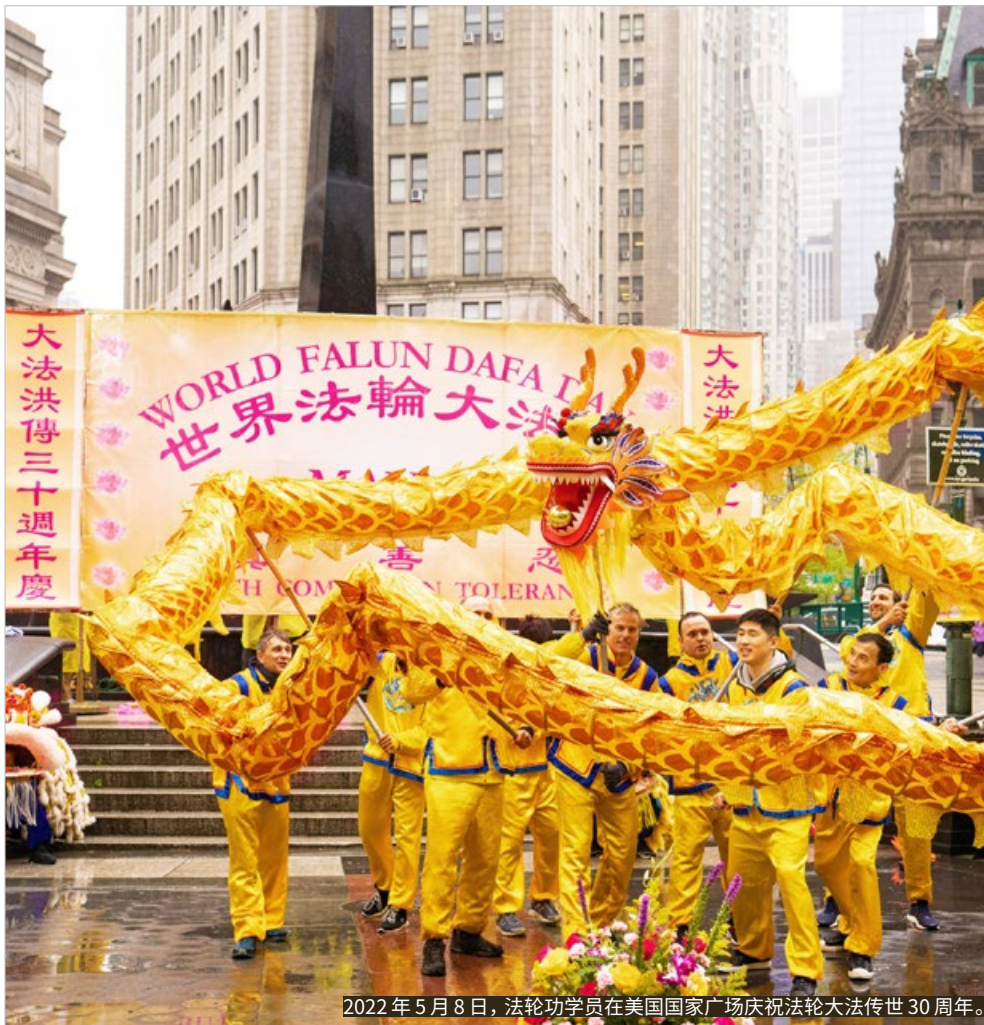
2022年5月8日，法轮功学员在美国国家广场庆祝法轮大法传世30周年。