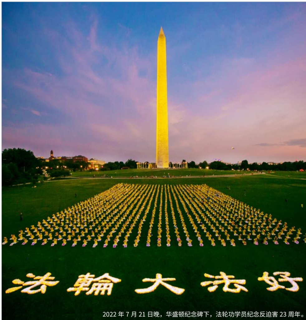
2022 年 7 月 21 日晚，华盛顿纪念碑下，法轮功学员纪念反迫害 23 周年。