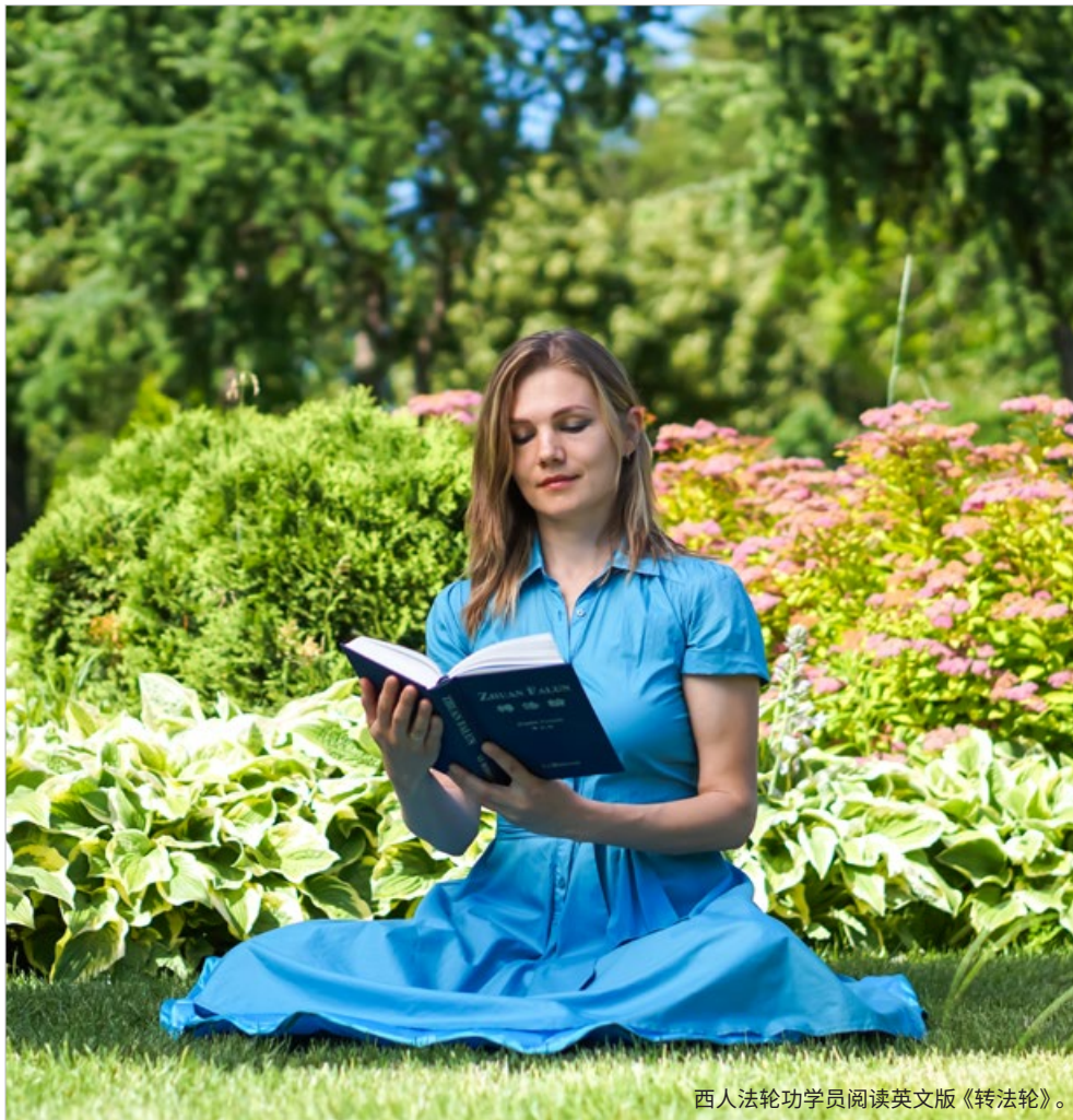
西人法轮功学员阅读英文版《转法轮》。