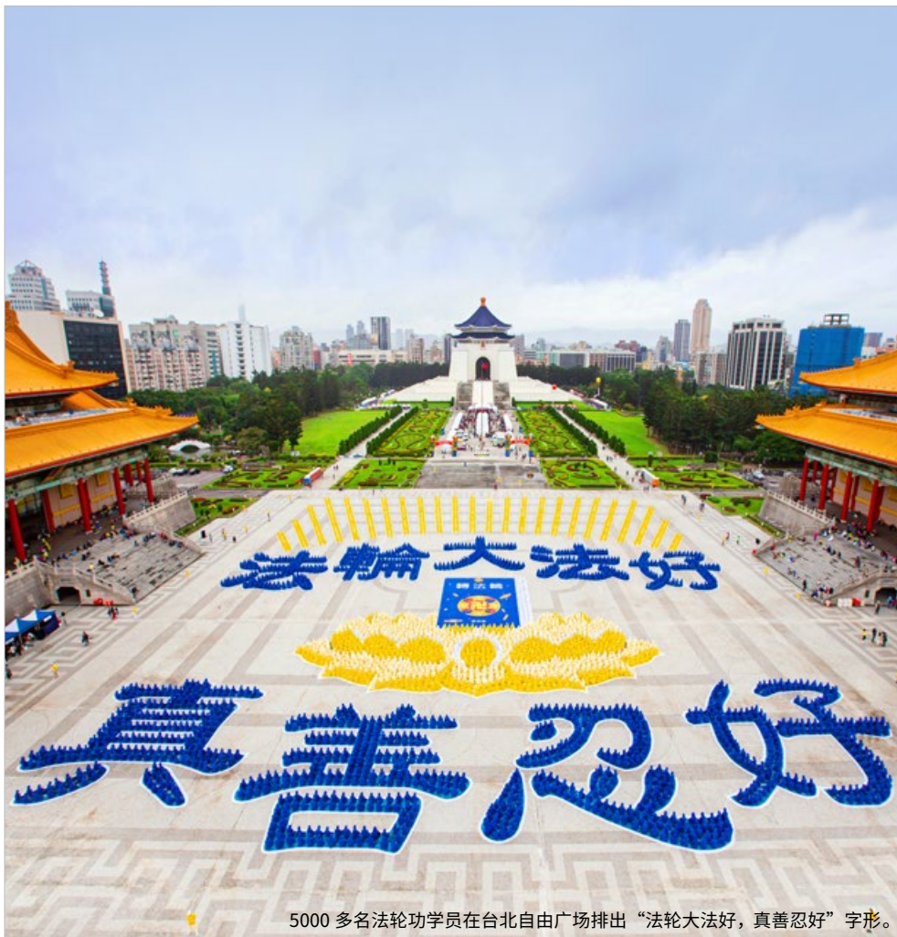
5000 多名法轮功学员在台北自由广场排出“法轮大法好，真善忍好”字形。