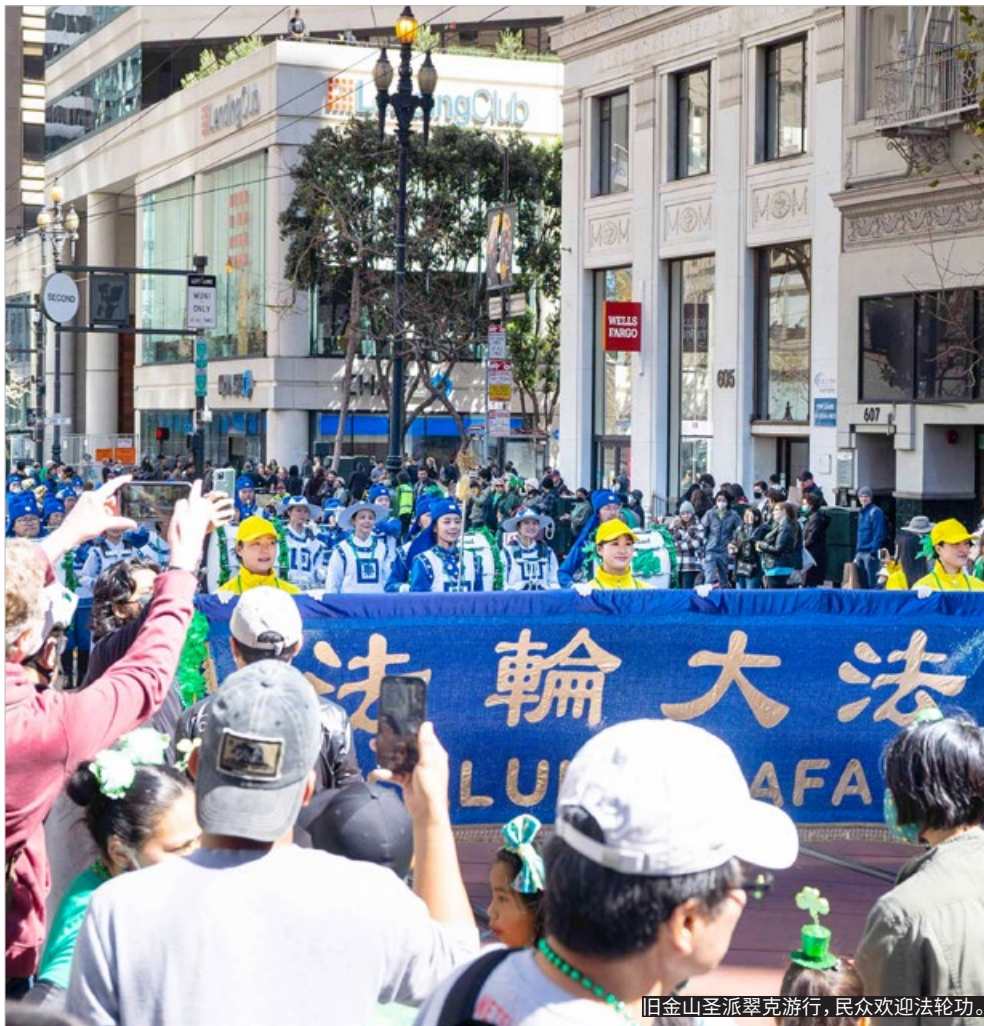
旧金山圣派翠克游行, 民众欢迎法轮功。