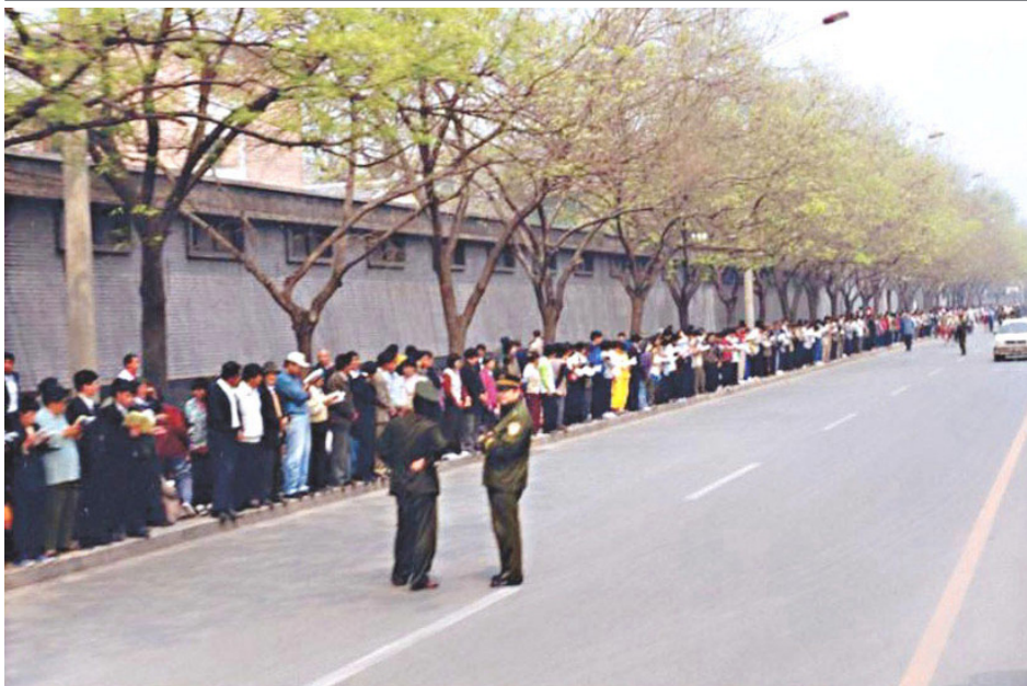
1999年4月25日上访现场秩序井然，警察不用维持秩序，在一旁聊天。