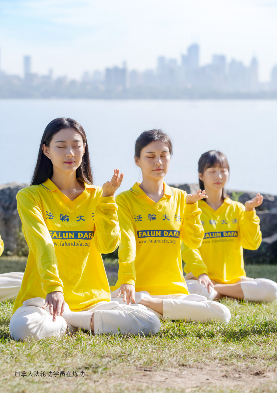
加拿大法轮功学员在炼功