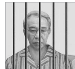
徐才厚，江泽民在军队迫害法轮功的急先锋，未审先死。