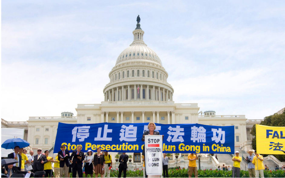
美国国会众议院通过 343 号决议案，要求中共停止摘取法轮功学员器官。