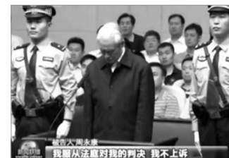
周永康，原中共政法委书记，迫害法轮功的元凶之一，被判无期徒刑。