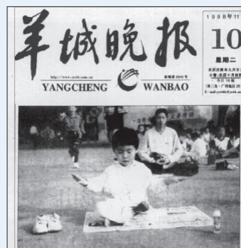
江泽民发动迫害之前，大陆媒体正面报道法轮功。羊城晚报：老少皆炼法轮功（1998年）

看遍法轮功的书籍，没有一句不让人吃药的话。江泽民为何要销毁法轮功书籍？就是怕其谎言被揭穿。