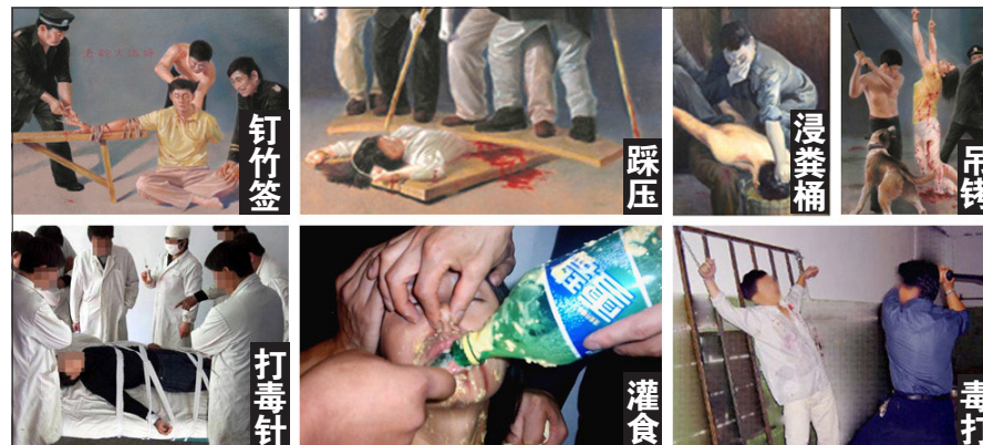
中共酷刑图示。法轮功学员遭非法监禁、酷刑折磨，被逼迫放弃信仰。已有4000多名能核实姓名的法轮功学员被迫害致死。