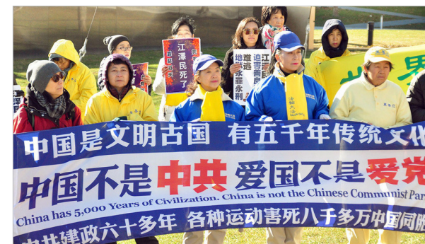
海外大游行中的横幅：中国不是中共，爱国不是爱党。

劝人“三退”（退党团队），是希望善良人废除毒誓，不随着其党遭厄运。修炼者关心的是人的生命安危，无关政治。