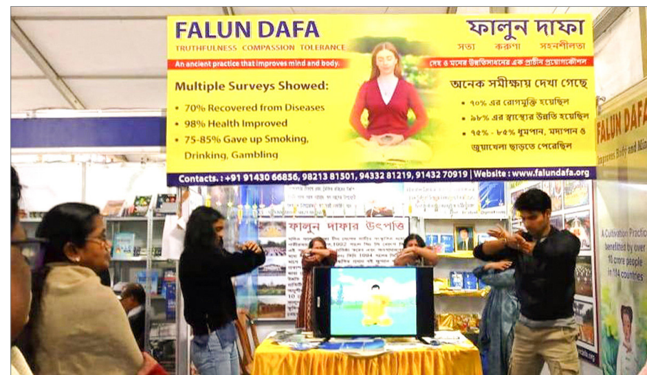
2020年2月，加尔各答图书博览会上，印度法轮功学员义务教功。

比特博士说：“修炼后，我知道了生命的意义。法轮大法的光芒点亮了我的生命，也照耀着我接触到的每一个人。”◇