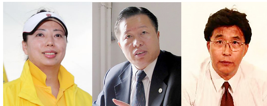
图6.5 从左至右：黄晓敏、高智晟、韩广生

2、“中国十大杰出律师”高智晟发表公开退党声明：“它，中国共产党！它把以最野蛮、最为不道德非法手段折磨我们的母亲、折磨我们的妻儿、折磨我们的兄弟姐妹，当成了它党员的工作任务，提高到它的政治高度，它在一刻不停地逼迫煎熬着我们人民的良