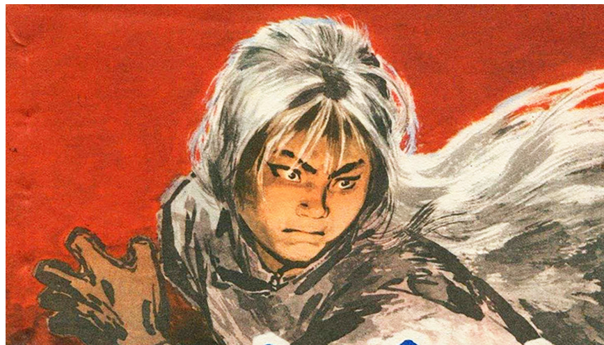
图2.1 《白毛女》连环画。中共借《白毛女》成功煽起了群众对“旧社会”的仇恨

传说在河北平山县的一个山洞里，住着一个长满白毛的仙姑。仙姑惩恶扬善，扶正祛邪，主宰人间祸福，因此人们都前去上供。在抗战期间的晋察冀根据地，因为晚上人们常常去给仙姑进贡，所以“斗争大会”开不起来。西北战地服务团的作家邵子南为配合“斗争”需要，把村民们从仙姑庙中拉回来，于是瞎编了一个民间故事，主题是“破除迷信，发动群众”，此为《白毛女》雏形。