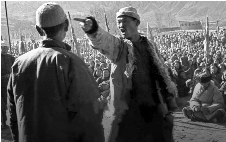
图4.1 农村痞子在中共干部鼓动下批斗地主

1959年，粮食减产，仍虚报高产，征购指标比实际产量高出一倍多。于是各地“暴力搜粮”，连农民的口粮也上交了。公社食