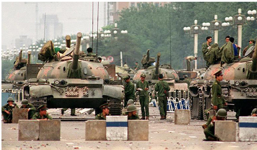
图 5.1 1989 年 6 月 4 日，北京天安门广场

来到美国的第二天，我就和来接飞机的同学们争吵了起来。我跟他们打赌，天安门根本没死人；对“六·四”的造谣是西方反华势力所为；你们可别忘了自己是中国人等等。可是同学们给