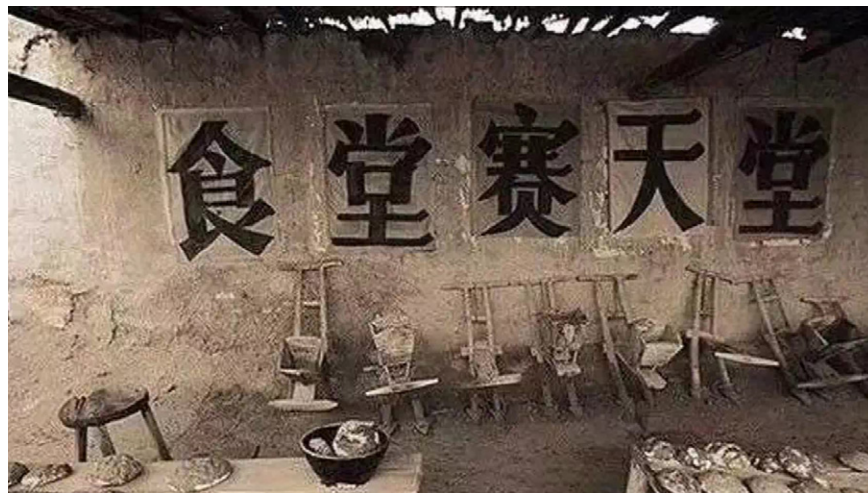
图4.4 人民公社时期的大食堂

1959年，粮食减产，仍虚报高产，征购指标比实际产量高出一倍多。于是各地“暴力搜粮”，连农民的口粮也上交了。公社食