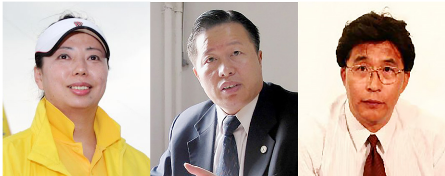
图6.5 从左至右：黄晓敏、高智晟、韩广生

2、“中国十大杰出律师”高智晟发表公开退党声明：“它，中国共产党！它把以最野蛮、最为不道德非法手段折磨我们的母亲、折磨我们的妻儿、折磨我们的兄弟姐妹，当成了它党员的工作任务，提高到它的政治高度，它在一刻不停地逼迫煎熬着我们人民的良