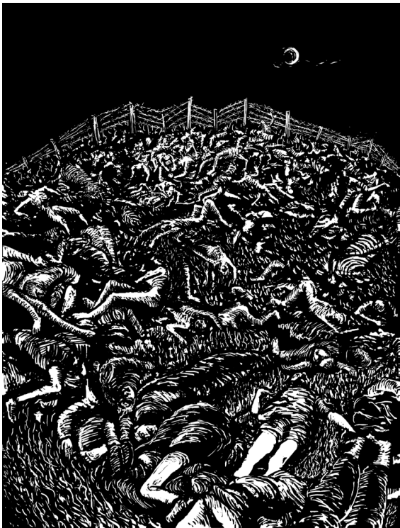
图4.2 饿殍遍野 插图 巴丢草

2006年6月4日，吉林省《新文化报》刊登了一篇报导——长春市绿园区青龙路附近一处正在挖掘下水管道的工地发现大量骨骸。报导说：“每一锹下去，都会挖出泛黄的尸骨。挖了4天，怎么也有几千具！”