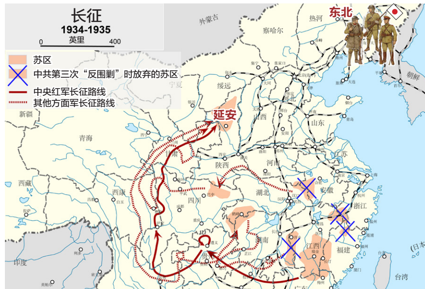
图 1.1 从红军长征路线和东北日军所在位置可以看出“北上抗日”只不过是逃跑的幌子

1935年6月，中央红军在懋功两河口与张国焘队伍会师，才决定“北上”方针，计划建立川陕甘根据地，但张国焘不同意。1935年9月18日，毛泽东偶然从旧的《大公报》上得知陕北依