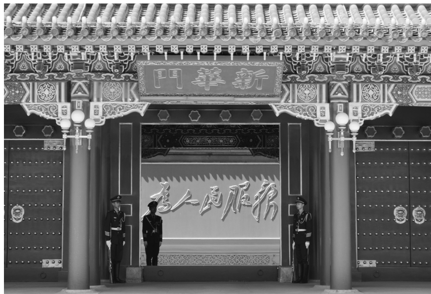
图 3.3 中南海新华门。中共“为人民服务”的背后，实则是“好话说尽、坏事做绝”。

中共欺骗了中国民众这么多年，把南泥湾种鸦片说成是种庄稼、养牛羊；把烧制鸦片的张思德说成是烧木炭，称赞他“为人民服务”。如今，那幅“为人民服务”的大标语，多少年来一直悬挂在北京中南海的影壁上，让人依稀看到当年中共制贩鸦片的影子，成为“好话说尽、坏事做绝”的中共最为“经典”的谎言之一。