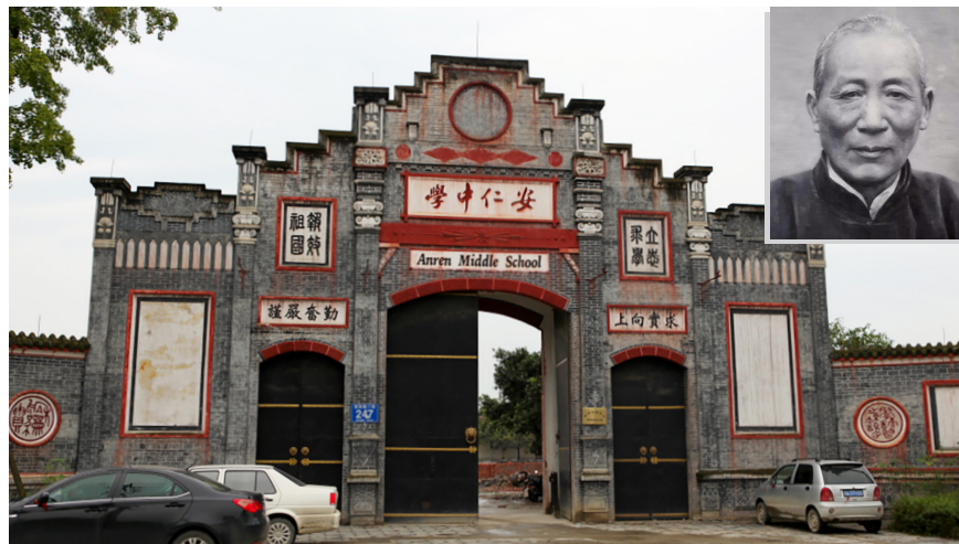
图 2.2 安仁中学的前身是刘文彩建立的文彩中学。右上图为刘文彩。

邑县提出“冷月英坐刘文彩家水牢”的方案，得到了主管部门认可。1958 年，主管部门将刘家地下室灌上水，仿制了铁囚笼、三角钉等刑具向社会开放。冷月英也开始到处声讨刘文彩的滔天罪行。后来有记者找到冷月英，她拒绝正面回答，情急之下脱口而出：“你们追着我问什么？又不是我要那样讲的，是县委要我那样讲的。”