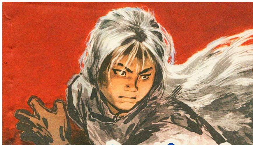
图 2.1 《白毛女》连环画。中共借《白毛女》成功煽起了群众对“旧社会”的仇恨。