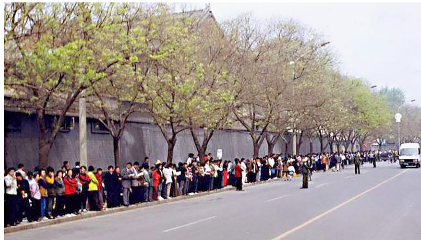
图 6.1 1999 年 4 月 25 日，北京，“4·25”现场。

1999 年 4 月 11 日，中科院院士何祚庥在天津教育学院《青少年科技博览》杂志发表文章，污蔑法轮功致人得精神病。天津法轮功学员去编辑部澄清真相，却遭到天津市公安局防暴警察的殴打，45 人被抓。4 月 25 日，万名法轮功学员到北京中南海附近