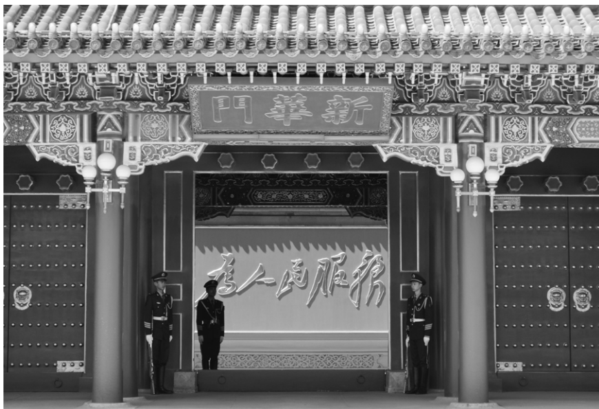
图3.3 中南海新华门。中共“为人民服务”的背后，实则是“好话说尽、坏事做绝”。

中共欺骗了中国民众这么多年，把南泥湾种鸦片说成是种庄稼、养牛羊；把烧制鸦片的张思德说成是烧木炭，称赞他“为人民服务”。如今，那幅“为人民服务”的大标语，多少年来一直悬挂在北京中南海的影壁上，让人依稀看到当年中共制贩鸦片的影子，成为“好话说尽、坏事做绝”的中共最为“经典”的谎言之一。