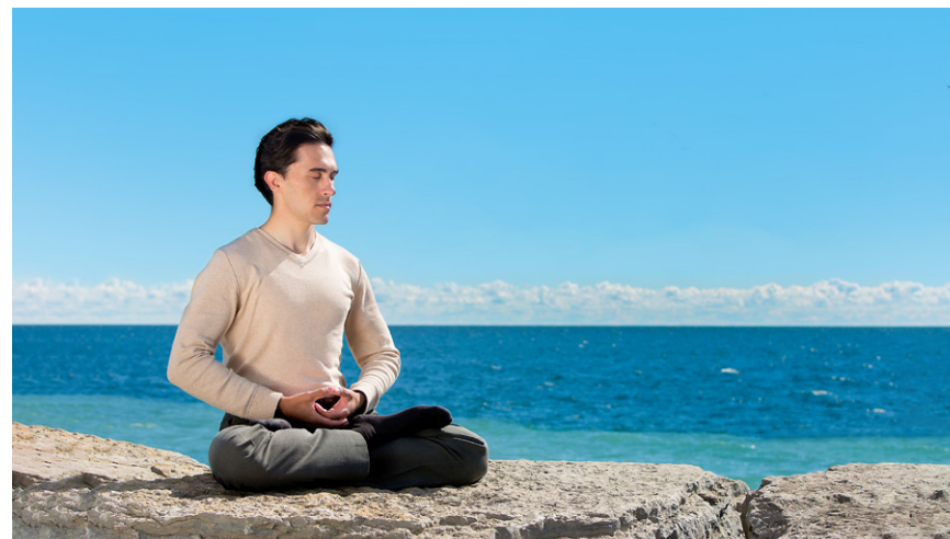
图6.6 加拿大法轮功学员在海边炼功

李洪志先生对弘扬正义却非常慷慨。1993年12月，李洪志先生在东方健康博览会上做气功报告会，收入4,000元；1994年5月在北京公安大学礼堂做了两场气功学术报告，收入近6万元，这些收入全部捐赠给了中华见义勇为基金会。他还将他的1,000本专著《法轮功》捐给基金会代赠各图书馆，价值6,600元。