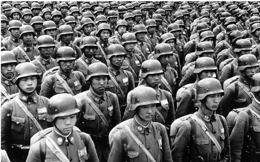
图1.2 1937年，参加淞沪会战的精锐国军——德械师，3万精兵在抗战一开始就壮烈牺牲。

中共一向声称是它领导全国人民抗击了90%以上的日军，是“抗日战争的中流砥柱”，但事实真的如此吗？