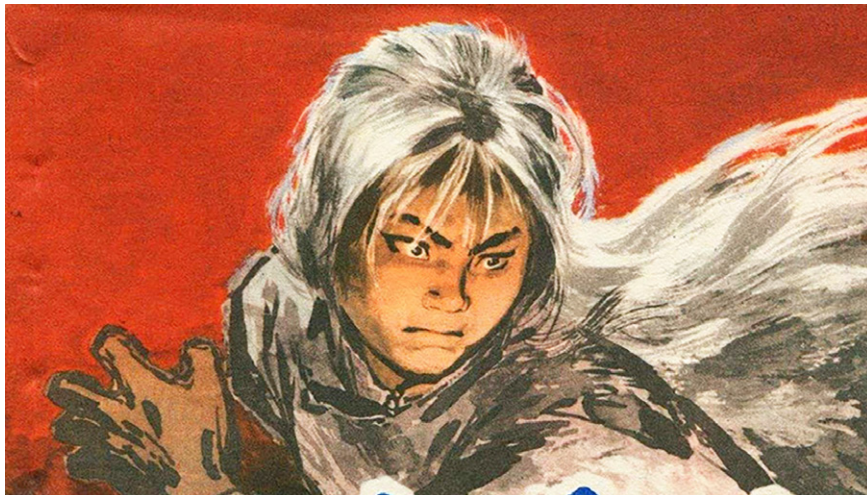
图2.1 《白毛女》连环画。中共借《白毛女》成功煽起了群众对“旧社会”的仇恨。

传说在河北平山县的一个山洞里，住着一个长满白毛的仙姑。仙姑惩恶扬善，扶正祛邪，主宰人间祸福，因此人们都前去上供。在抗战期间的晋察冀根据地，因为晚上人们常常去给仙姑进贡，所以“斗争大会”开不起来。西北战地服务团的作家邵子南为配合“斗争”需要，把村民们从仙姑庙中拉回来，于是瞎编了一个民间故事，主题是“破除迷信，发动群众”，此为《白毛女》雏形。