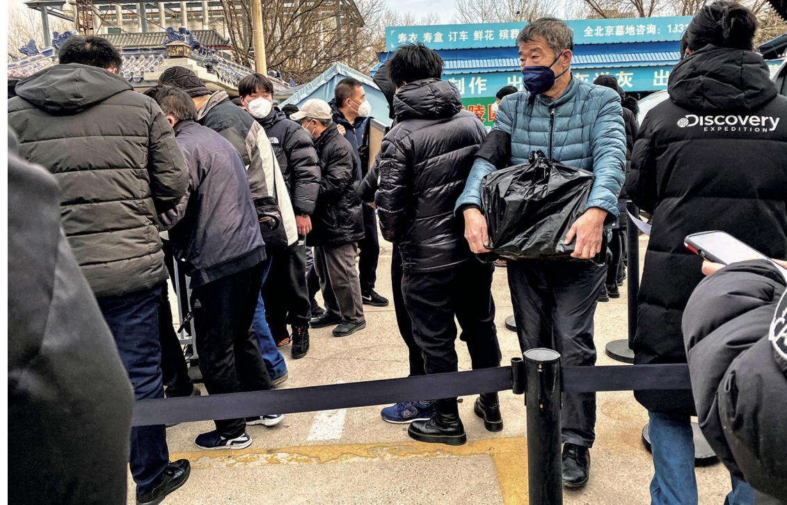
■ 베이징 어느 장례식장 밖 광경

이번 역병과 관련해 파룬궁 창시자 리훙쯔 대사는 《이성(理性)》이란 글에서 직접 명시하셨다. “중공 바이러스(우한 폐렴) 이런 역병은 목적이 있으며, 목표를 가지고 온 것이다. 그것은 사당분자(邪党份子) 및 중공사당(中共邪党)과 함께하는 사람들을