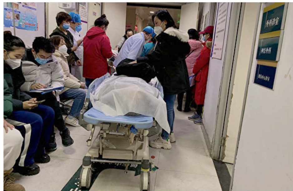
▲ 疫情大爆发期间，中国天津市第一中心医院照片。

神韵现在以8个团的规模在世界各地演出，关于演出的详情，请参阅神韵官方网站 shenyun.com 。■