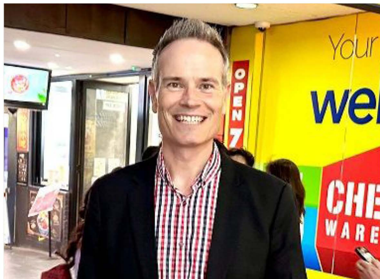
◀ 新南威尔士州立法会议员蒂莫支持法轮功真、善、忍的普世价值。

他还说：“真、善、忍普世价值是我们生活方式的根本，对我们社区，和我们作为人来说都是最基本的，非常重要的，人们都应该遵循这些价值观。” ■