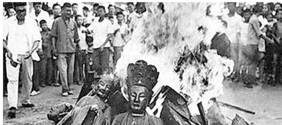
▲ 文化大革命期间，中共在全国范围内“破四旧”，寺庙中的佛像多被砸毁并付之一炬。

1957 年要打核大战，死 3 亿人不在乎，大饥荒、文革死亡近 8000 万中国人。