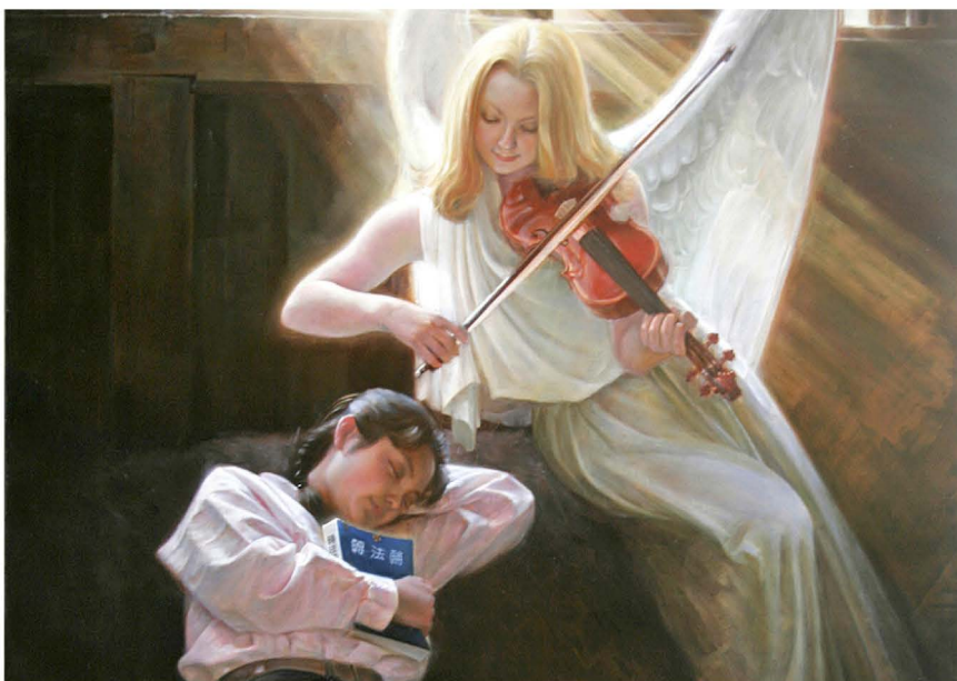
▲ 《真善忍美展》画作，信神的人们会受到神的庇护。

朋友，其实，我们都是有神性的人。让我们好好思量，好好一起把握这个走向未来的生机。■