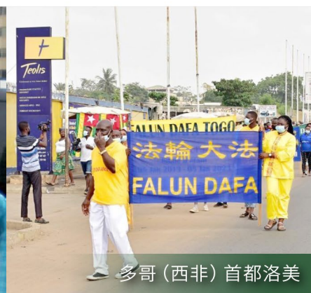
多哥（西非）首都洛美