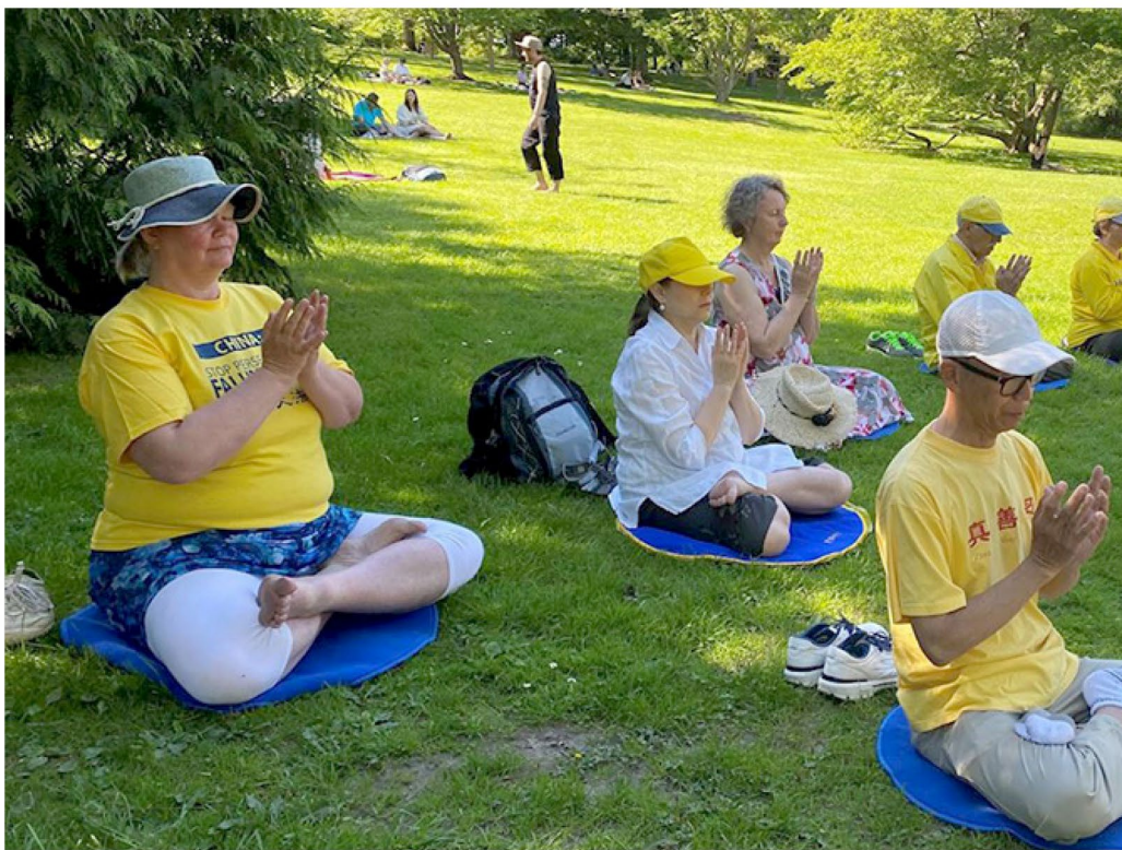
▲ 许多法轮功学员得法后纷纷受益，主动在哥德堡的植物公园举行弘法活动。

帮我们调整身体，我的注意力始终跟随着师父。学习班结束后，我感到心情愉悦、走路一身轻，端坐在驾驶室里开着车，很轻松地就到家了。来的时候那个令人烦恼的腰疼，也不知道什么时候消失的。”