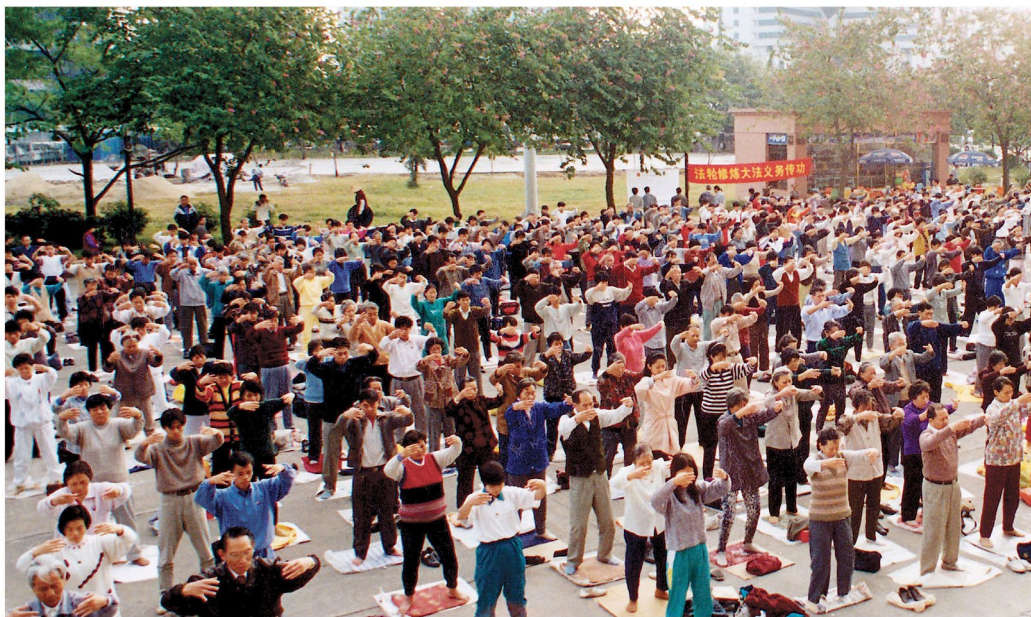
▲ 北京举办过 13 期法轮功传授班。图为学员晨炼盛况。

为修炼原则，自 1992 年公开传出后，因为祛病健身功效显著、功法简单易学、免费教功等特点，受到广大群众的喜爱。从 1996 年开始，修炼法轮功的人数迅速增长，中共各大部委也有越来越多的人开始炼功。到 1999 年，中国大陆学炼法轮功者已达 1 亿人。