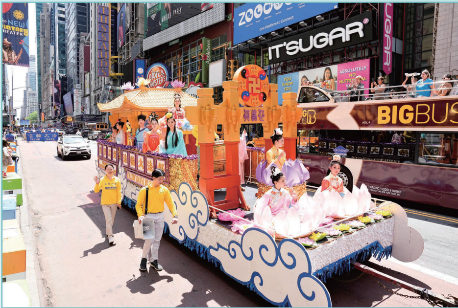
▲ 2023년 5월 12일, 수천 명의 파룬궁 수련생이 미국 뉴욕 맨해튼에서 파룬따파 세계 흥전 31주년과 제24회 세계파룬따파의 날을 축하하는 대형 퍼레이드를 개최했다.