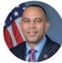
하킴 제프리 (Hakeem Jeffries)

“파룬궁은 세상을 변화시켰습니다. 우리는 ‘진선인’을 파룬파의 초석으로 다진 탁월한 식견을 갖춘 리홍쯔 선생께 계속 감사해야 합니다. 트뤼도 총리와 자유당 단체를 대표하여 여러분 모두를 격려하고 싶습니다. 계속해서 여러분의 메시지, 즉 평화와 안녕에 대한 메시지를 전하기 바랍니다. 이것이 대법제자들이 창도하는 ‘선(善)’입니다.”