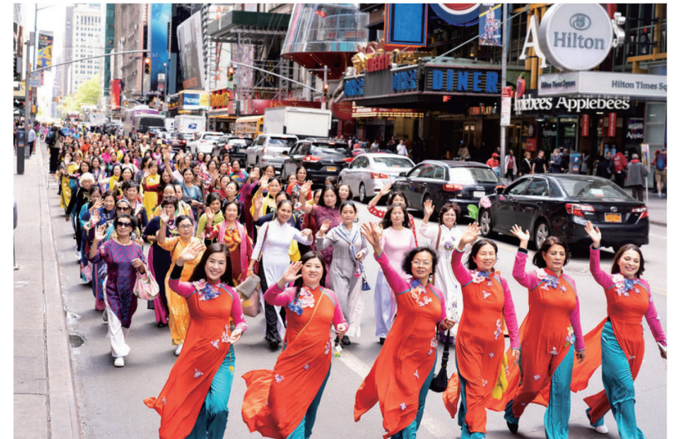
▲2019년 5월 16일, 뉴욕에서 ‘세계 파룬따파의 날’ 경축 퍼레이드에 참여한 베트남 파룬궁 수련생들.

3개월 후 어느 날, 응우옌은 마침내 정상인과 똑같이 걸을 수 있게 되었다. 그 날, 그녀는 울면서 연공장에서 집으로 돌아왔는데 이는 기쁨과 행복의 눈물이었다. 응우옌은 “파룬따파는 저에게 새로운 생명을 주었습니다. 예전의 저와 같은 고통에 시달리는 사람들이 ‘전법륜’을 통독할 기회가 주어지길 바랍니다.”라고 전했다.