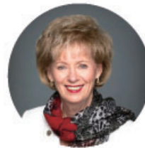
주디 스그로 (Judy Sgro)

“‘진선인’은 평화와 민주 그리고 열린사회를 건설하는 기본 원칙입니다. ... 파룬궁 수련생은 평화롭고 솔직한 착한 수련자들입니다. 이들은 주변 생활환경에 긍정적인 영향을 주었고 사람과 사람 사이가 평화롭게 지내는 데 이바지했습니다.”