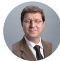
마우로 포지아 (Mauro Poggia)

“파룬파는 여러 해 동안 많은 사람의 삶에 없어서는 안 될 긍정적인 부분이었습니다. ... 그 실천은 우리 사회에도 확실한 효과를 가져왔습니다. ... 그래서 우리는 이 기념일을 축하함과 아울러 리홍쯔 선생께서 이런 수련법을 창안해 주신 것에 대해 더 없는 감사를 드립니다.”