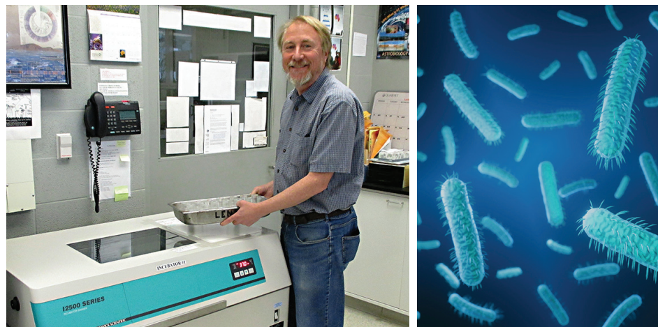
左图：美国科学院院士、密西根州立大学教授兰斯基 (Richard Lenski)。右图：大肠杆菌

我学了大法后，作业及时完成，有时想玩，一想作业还没写呢，就马上去写作业，写完作业再玩，不用爸爸妈妈督促。我的学习成绩越来越好，老师讲数学的时候，别的同学感觉很难，我一听就会，一点不觉得难，每次考试，成绩都是班里前三名。有不会的时候，我就求师父，比如有一次，考