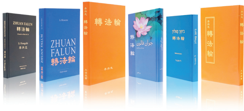
《转法轮》出版近30年，被翻译成40多种语言在世界各地发行。一本奇书改变上亿人。

记得第一次班导师教我打坐时，我的腿特别痛，但坚持一段时间后，我的腿竟然不痛了。现在午休跟同学一起盘腿打坐，特别舒服。有一次，我觉得头很晕，下楼去健康中心的路上，我嘴里不断念着九字真言“法轮大法好，真善忍好”，没多久头就不晕了，当时我觉得好神奇！